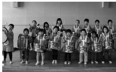
▲新しい鼓笛隊セットをうれしそうに手にする北方幼稚園幼年消防クラブの園児たち