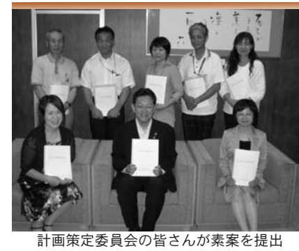
計画策定委員会の皆さんが素案を提出

東日本大震災の経験をもとにさらに内容を検討 第2次登米市男女共同参画基本計画素案の策定に取り組んでいる同計画策定委員会が7月21日、これまで検討を重ねてきた基本計画の素案を市長に提出しました。