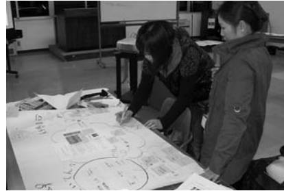
昨年度の第3回講座「ワークショップ」の様子