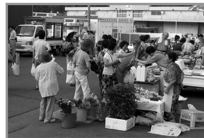
▲新鮮な野菜や旬の食材を求め、多くの人でにぎわう朝市会場

生産者と消費者の交流を深めようと8月12日、JAみやぎ登米石越支店駐車場を会場にふれあい朝市が開催されました。午前6時の花火を合図に朝市が始まると、多くの人々が会場に集まり石越産大豆100%使用の納豆、豆腐、油揚げが入った100組限定の「ニコニコセット」が早々に完売するなど、多いにぎわいました。また、出店コーナーでは地元産の野菜や生花なども出品され、来場者は生産者と言葉を交わしながら商品を購入し朝市を楽しんでいました。