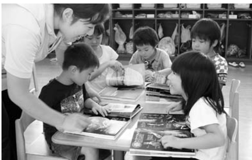
本を通じ子どもたちに希望と夢を(よねやま保育園)

東日本大震災で被災した子どもたちを本で支援しようとして7月27日、富山県に本社を置く明文堂プランナーから児童書や辞典など2342冊(約500万円相当)が寄贈されました。