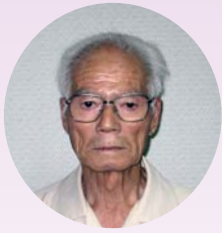
登米謡曲会米山支部支部長