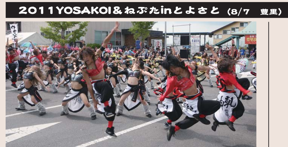
2011 YOSAKOI & ねぶた in とよさと (8/7 豊里)

で、各地域を舞台に夏祭りが盛大 でたくさんの人でにぎわいました。 人々が酔いしれる登米市自慢の夏 出がいくつできましたか？ がった今年の夏祭りの様子をまと