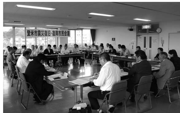
各委員が、今後の登米市の復興に向け意見を出し合いました

公民館で開かれました。市民会議は、総合計画審議会の元委員や社会福祉協議会をはじめとする市内各団体の長、市内9地区の地域づくり委員会委員など18人で構成。当日は14人が参加し、今後