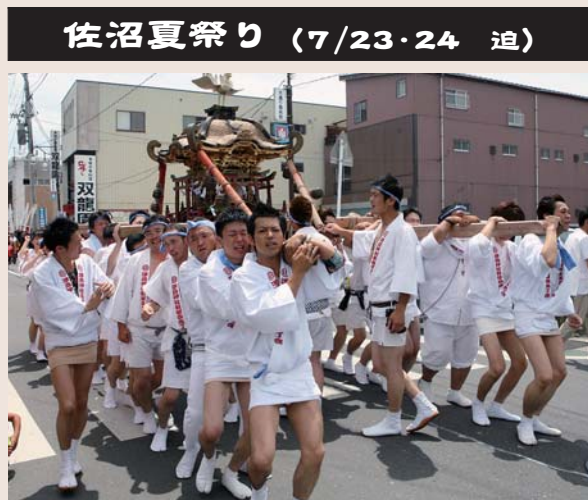
佐沼夏祭り (7/23・24 追)

登米市の夏は「祭りの夏」。 今年も7月下旬から8月下旬ま に開催されました。 各祭りとも、子どもから大人ま 山車にみこしに屋台に花火、 祭り。皆さんは記憶に残る思い このページでは、熱く盛り上 めてご紹介します。