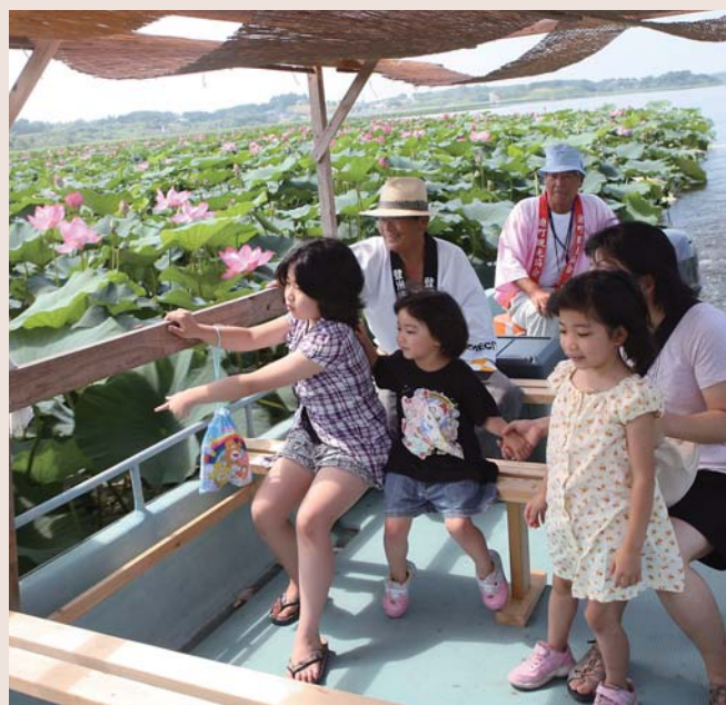
長沼はすまつり (8/1~31 追)