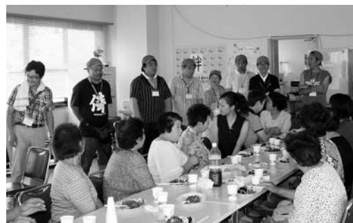
ボランティアの皆さんに感謝(ふるさと交流館)

東日本大震災の発生以来、約5カ月間にわたり開設された市民の避難生活を支えてきた市内各避難所で、被災者の仮設住宅やアパートへの入居が決定したことに伴い、閉所式・分散会が行われました。追町ふるさと交流館では7月17日、利用者とともに食事を提供してくれたボランティアや周辺の巡回警備に当たった駐在所員を招いての昼食会が開催され、感謝を込めて全