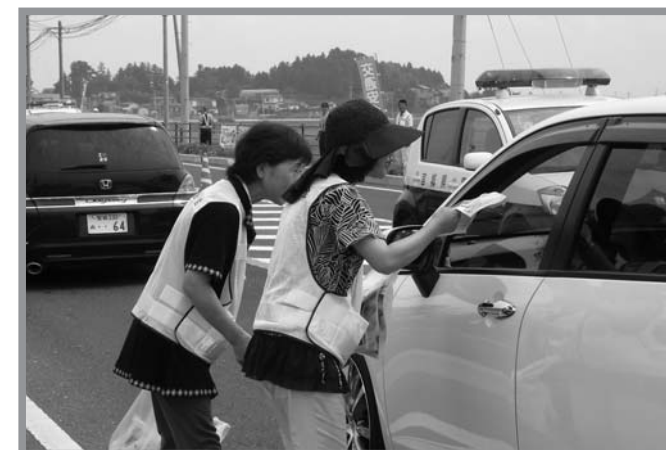
▲「安全運転を」とカエルのマスコットを配布し交通安全を呼び掛け

佐沼地区交通安全協会南方支部で、毎年お盆の帰省時期に実施している「無事カエル作戦」が8月7日に、佐沼警察署、高石・東郷駐在所の協力のもと、県道古川・佐沼線（市役所南方庁舎前）で実施されました。この作戦は、交通ルールを守り、安全運転で家族の待つ家へ「無事帰る」よう願いを込めて実施されたもので、当日は、日曜日ということもあり家族連れの車が多い中、交通安全協会南方支部女性部役員の皆さんが笑顔で可愛いカエルのマスコットを1台1台の車に届け、安全運転を呼び掛けました。