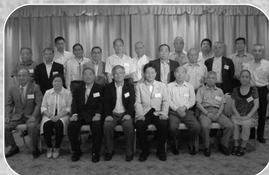
▲総会に出席した各地区町人会の代表の皆さん

東京都内の東天紅上野店で7月15日、在京町人会連絡協議会総会が開催されました。総会では11月に在京町人会員交流会を開催することが決定されたほか、市から東日本大震災の被害状況やコールセンター立地などの情報提供が行われました。また、懇親会では市長を交え、各町人会の近況報告や情報交換を行いながら大いに交流を深めました。