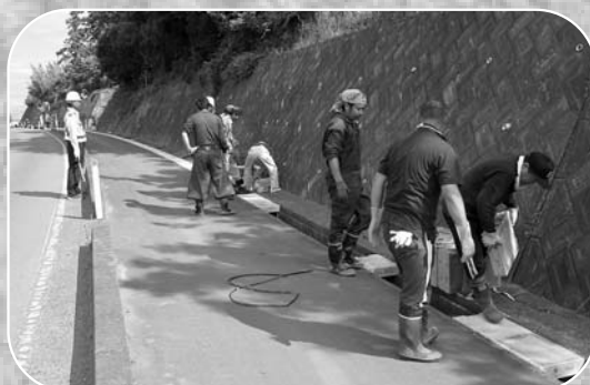
▲重いふたに苦戦しながらも、皆で協力して設置

住み良い道路環境を作ろうと、米山町畑崎地区の住民による道路保全活動が7月24日、県道河南米山線において行われました。当日は、県土木事務所の協力のもと多くの住民が参加し、通行の際危険だった側溝にふたを設置しました。同地区では今後、県と協力し道路の美化活動を行う「スマイルサポーター」として各種活動を行っていきます。