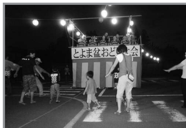
▲天候に恵まれ、大勢の人が参加して行われた盆踊り大会

登米地区の夏の伝統行事になっている「とよま盆踊り大会」（とよま盆踊り実行委員会主催）が8月15日、帰省客や地域住民の皆さんなど約400人が参加し登米交通公園で開催されました。公園の中心にやぐらが組み立てられ、カラフルなちょうちんが飾られた会場では、子どもからお年寄りまでがやぐらの周りに輪を作り、おはやしや盆踊り唄に合わせて踊りを楽しみました。また、恒例のお楽しみ抽選会が行われ、市長賞やコミュニティ会長賞など豪華な賞品が当たるたびに会場からは、大きな歓声が上がっていました。