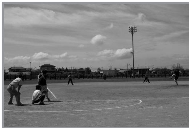
▲晴れ渡る夏空の下、優勝を目指して熱戦を繰り広げる選手たち

豊里地区の夏の恒例大会となっている豊里地区対抗野球大会(豊里地区体育協会主催)が7月24日に開催されました。この大会は昭和25年に第1回大会が開催され、今年で62回目となる伝統ある大会で、今年は町内各地区から6チームが出場。30度を超える真夏日の中、各チームとも熱戦が繰り広げられ、選手たちは互いに声を掛け合いながら白球を追い掛けました。大会結果は、過去12回の優勝歴を持つ下町チームが優勝の栄冠に輝きました。【優勝】下町【準優勝】大曲【第3位】新町、保手