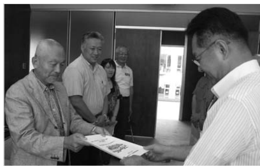
市民意見が盛り込まれた素案を市長に提出

平成24年4月1日の施行を目指す(仮称)登米市まちづくり基本条例」の制定に向け、「登米市まちづくり基本条例策定委員会活動状況報告会」が7月30・31日にかけて、市内3会場で開催されました。