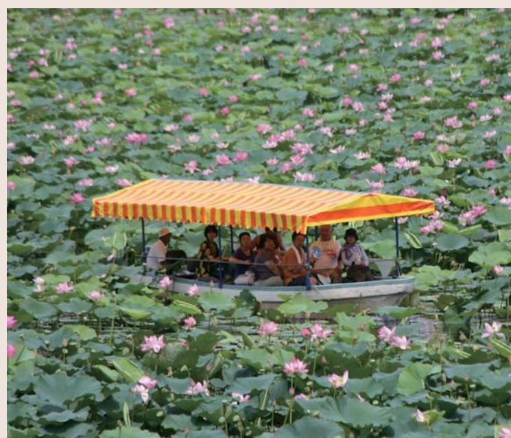
伊豆沼・内沼はすまつり (8/1~31 追)