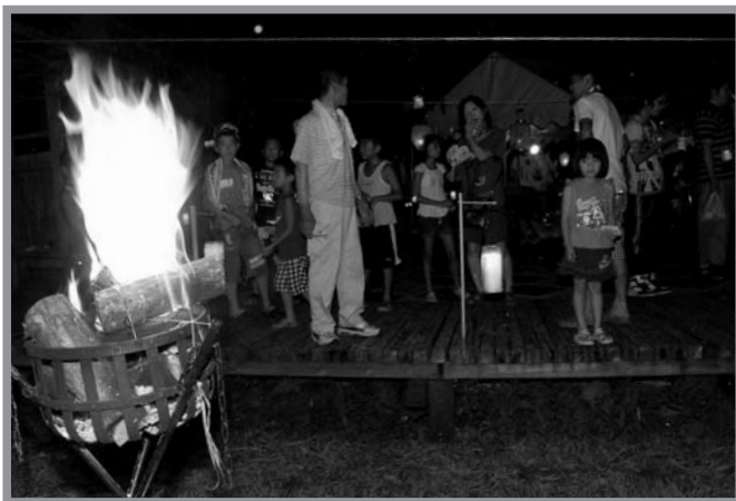
▲赤々と燃えるかがり火に、震災犠牲者の冥福を祈りました