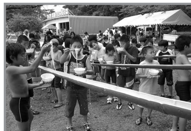
▲昼食には、みんなでジャンボ流しソーメンを楽しみました