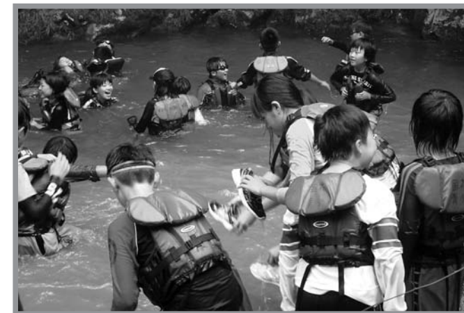
▲皆ずぶ濡れになりながら、元気一杯に沢遊びを楽しむ子どもたち

合宿を通して、新しい仲間と自然の中で多くの事に挑戦することにより、子ども会の活性化と地域リーダーの養成を目的に「迫っ子サマーキャンプ」が8月3～4日、国立花山少年自然の家で開催されました。参加者は迫町内小学校の5～6年生で、迫町ジュニアリーダー「青びつき」の皆さんにお世話してもらいながら、沢遊びや野外炊飯にチャレンジしました。沢遊びでは、水を掛け合いながら仲間と一緒に自然を満喫し、野外炊飯では、自分たちでカレーを作り、みんなで野外での食事を楽しみました。