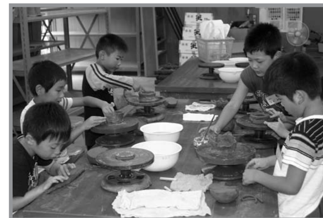
▲慣れないろくろに苦戦しながらも、思い思いの作品を作りました

芸術文化活動をとおして心豊かな子どもを育てることを目的に、津山陶芸館において「森の子ども陶芸教室」の1回目が8月2日に開催されました。この教室は長い夏休みの期間を利用し、津山町内の小学生を対象に毎年開催されていて、陶芸製作の基礎から色付け、完成までの工程を学びました。子どもたちは使い慣れないろくろや、なかなか思いどおりにならない粘土に苦戦しつつも、完成した作品を想像しながら、思い思いにいろいろな形の作品を楽しみながら作りました。