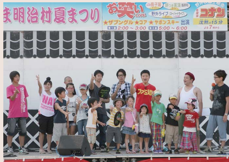
とよま明治村夏まつり (8/6 登米)