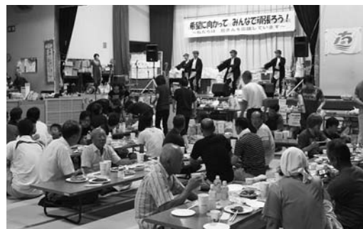
今後の友好と復興を誓って(登米公民館)

復興が一日も早く実現するよう明日の希望に向かって皆でがんばりましょう」と決意の言葉を述べました。各避難所とも参加者は約5カ月にわたる集団生活を振り返りながら、感謝の思いを胸に刻んでいました。被災者の仮設住宅やアパートなどへの入居が進んだことから、市内のすべての避難所は、8月20日をもって閉鎖されました。