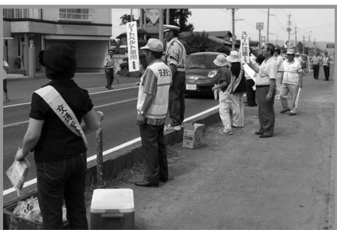
▲真夏の日差しの下、各団体が協力し通行車両に交通安全をPR

夏の交通事故凍結(アイス)大作戦が、8月7日、国道346号線宝江黒沼十文字地内で開催されました。この事業は、中田町交通安全団体連絡協議会が夏の交通事故防止運動の一環として実施したもので、交通事故を凍結しようとアイスシャーベット500本と事故防止のチラシなどを通行車両に配り、居眠り運転や交通事故の防止を呼び掛けました。当日は最高気温が30度を超える猛暑の中、アイスシャーベットを配られたドライバーは「アイスを食べた交通事故を凍結します」と笑顔で話していました。