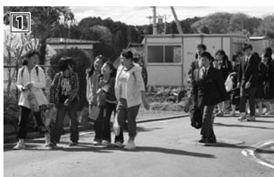
①旧善王寺小学校校舎を使った新しい学校生活に緊張しながらも元気に登校する戸倉小・中学校の児童生徒 ②先生からの質問に「ハイ」と元気一杯な返事 ③久々に再会したクラスメイトとの談笑