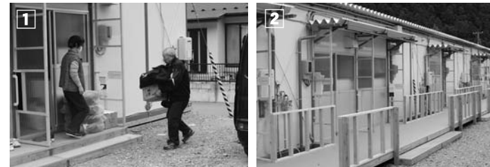
①避難所から仮設住宅へ、生活用品を運び入れる入居者 ②多くの事業所や団体から協力をもらい、早期に完成した仮設住宅

当日は、抽せんで入居が決まった人たちが次々に訪れ、自家用車などで、布団や衣類などを運び込み新生活をスタートさせていました。