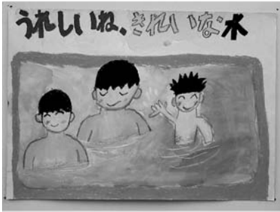
▶第52回水道週間作品コンテストで入選した作品 【図画・小学生低学年の部・特選】