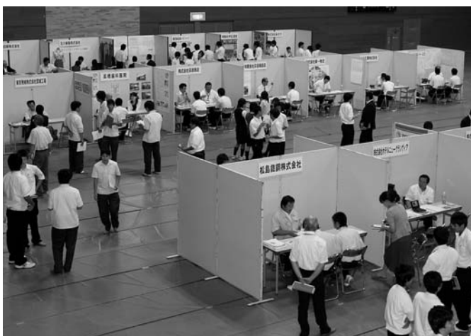
学生・生徒の市内企業への就職をサポート「企業ガイダンス」