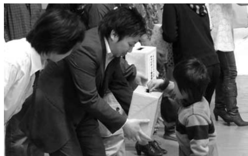
会場に訪れた人から、温かい善意の寄付

東日本大震災被災者への応援や被災地域の復興を支援する事を目的として4月17日、市迫体育館で地元を中心に活躍しているアーティストによる震災復興チャリティコンサートが開催されました。