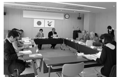
【男女共同参画条例策定委員会】