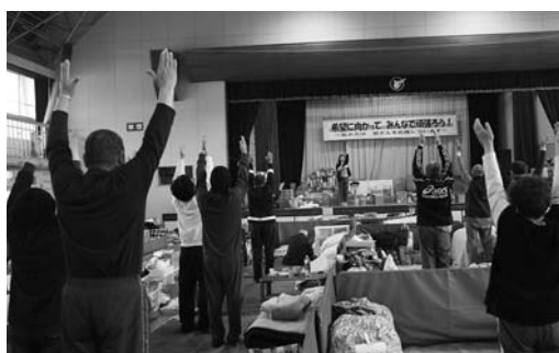
ヨガのいろいろなポーズで、心身ともにリフレッシュ