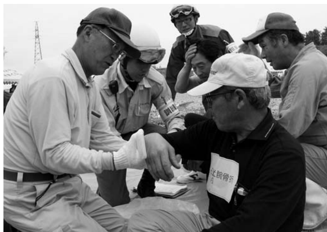
災害時における「共助」の中核となる「自主防災組織活動」

おたふくかぜ、水痘ワクチン接種は、本市の独自事業として3000円の助成を引き続き実施し、ヒブ、小児肺炎球菌ワクチン接種は国と本市が2分の1ずつ負担します。 子宮頸がんワクチン接種は、中学1年生から高校1年生までは国と本市が2分の1ずつ負担し、更に、市独自事業として助成対象を高校2年生、3年生まで拡大して、費用の全額を助成します。