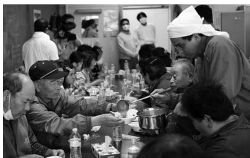
「たくさん食べて」とカレーを振舞う会員の皆さん