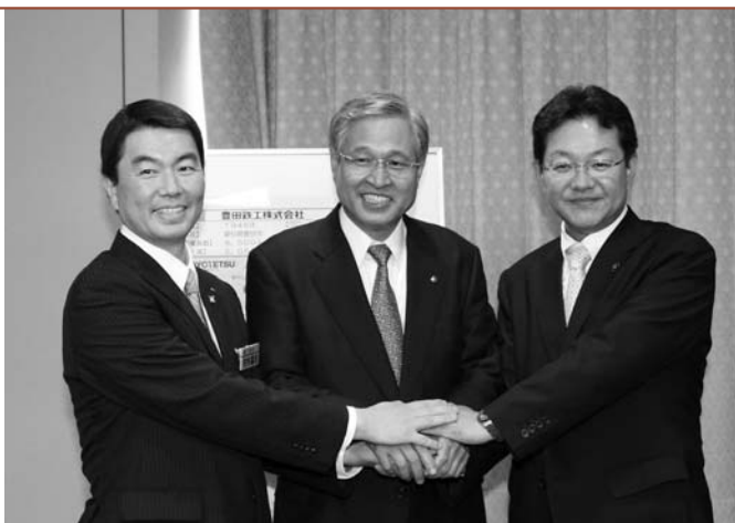
長沼工業団地への立地により産業振興へ大きな期待「豊田鉄工」

校跡地などの環境整備を進めるとともに、引き続き企業の誘致に努めていきます。 ◎ 観光・物産振興 本年から、「仙台・宮城伊達な旅キャンペーン」が夏に実施されることから、「登米市観光商品開発実証事業」により、新たな夏の観光資源の掘り起こしと商品開発に取り組みんでいきます。