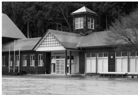
東和国际交流センター (東和)