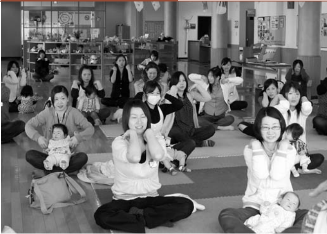
豊かな子育て環境をサポートします「赤ちゃんサロン」

震改修事業」、「危険ブロック塀等の除去事業」などの住宅事業の実施、公共施設の修繕・改修計画に基づいた年次計画による公共施設の維持修繕を行っていきます。