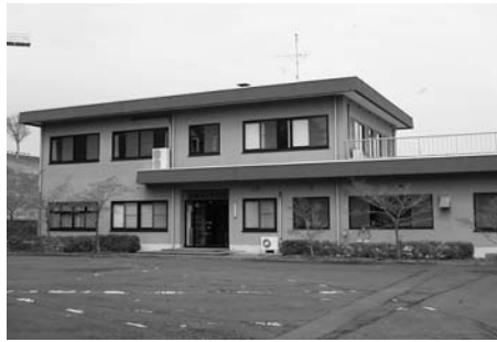
ふるさと交流館 (迫)