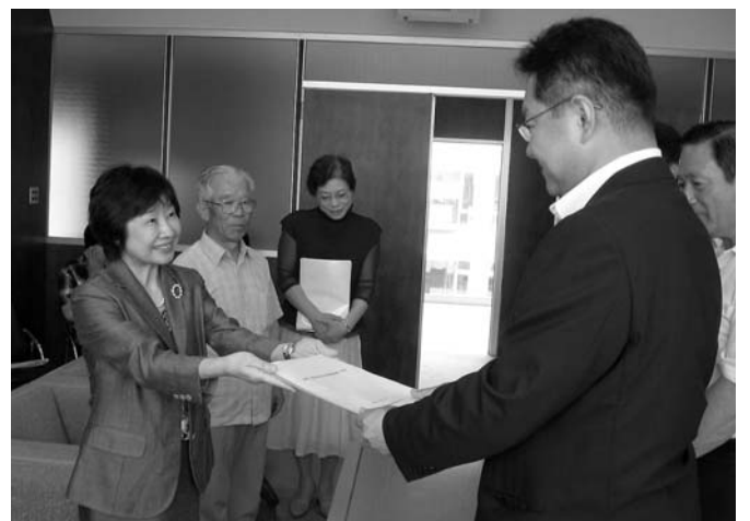
市民の意見を集約した条例の素案を提出「男女共同参画」

潤す「登米耕地」や豊富な「森林資源」、そして先人が築き上げた「歴史・伝統・文化」が息づいています。