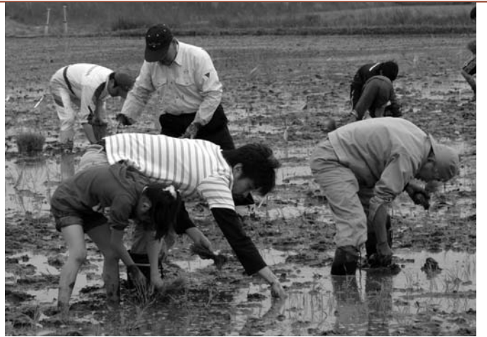
古代米稲苗でアートを描き循環型登米市農業をPR「稲アート」

「産業の振興」「定住の促進」そして「地域の自立」の「3つの柱」を基本に市政運営を進めていきます。