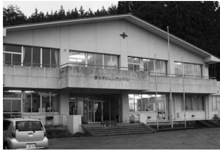
旧嵯峨立小学校 (東和)