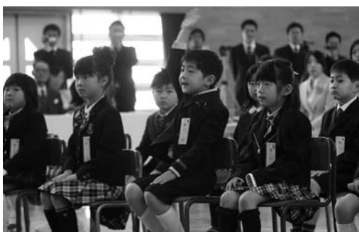
名前を呼ばれ「ハイ」と元気な返事 (浅水小)

その後、2年生の皆さんから、1年生を歓迎するピアノ演奏や、全学年でBELIEVE (ベリーブーブ) の合唱が行われた後「皆さんの入学を楽しみに待っていました。学校には、楽しい行事がたくさんあります。明日から一緒に楽しく過ごしましょう」とお迎えの言葉が送られ、新入学児童は小学生の仲間入りをしました。