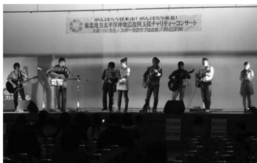
コンサートに参加したアーティストの皆さん

東日本大震災被災者への応援や被災地域の復興を支援する事を目的として4月17日、市迫体育館で地元を中心に活躍しているアーティストによる震災復興チャリティコンサートが開催されました。