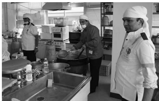
早朝から、本場のネパールカレーを準備

本場のネパールカレーを食べた皆さんは「温かい食事なので助かります」、「マイルドな味で、とても美味しい」と話し、協会の善意に感謝していました。