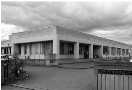
豊里多目的研修センター (豊里)