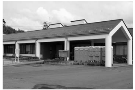
迫保健センター (迫)