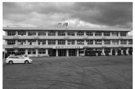
旧善王寺小学校 (米山)