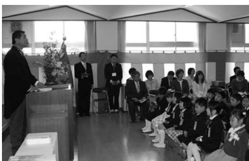
校長先生と学校でのお約束をしました (米川小)

また、今年度は、東日本大震災で本市に身を寄せている児童生徒が市内小中学校18校に転入し、地元の児童、生徒と一緒に温かく迎えられ、各学校で新しい学校生活をスタートしました。