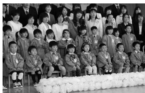
みんなで一緒に記念写真 (新田幼)