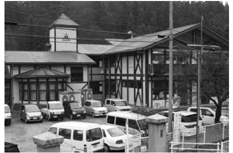
旧鱒淵小学校 (東和)