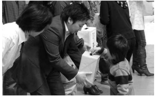
会場に訪れた人から、温かい善意の寄付

会場には、約130人が来場し、会場に設置された募金箱には、来場した皆さんから21万3676円もの温かい善意が寄せられました。寄せられた義援金は、関係機関を通じて被災地に届けられます。