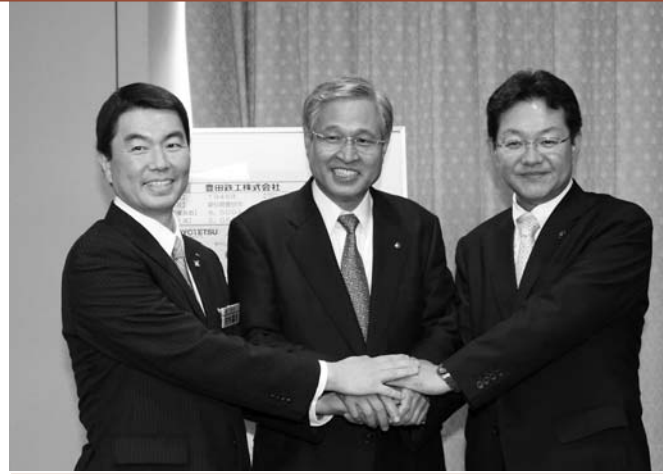
長沼工業団地への立地により産業振興へ大きな期待「豊田鉄工」

備を市民の視点で進め、「安心して暮らせる地域づくり」を目指してまいります。 ◎医療の確保 各医療機関の機能の明確化と連携の強化を図るため、佐沼病院については「登米市民病院」と名称を変更し、回復期リハビリ病棟を新設した新たな体制での病院運営を目指