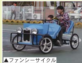
▲ファンシーサイクル