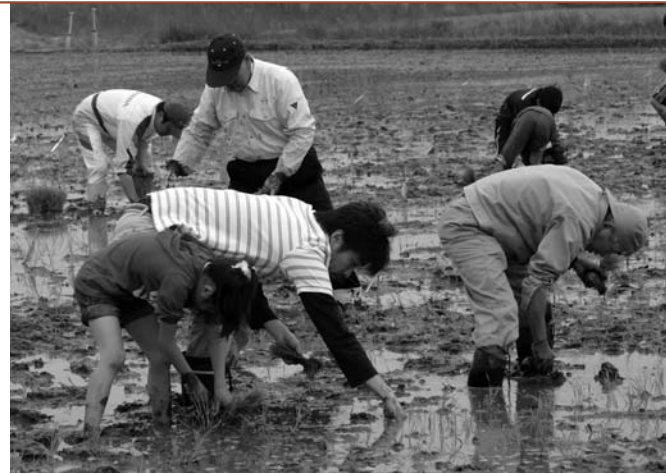
古代米稲苗でアートを描き循環型登米市農業をPR「稲アート」