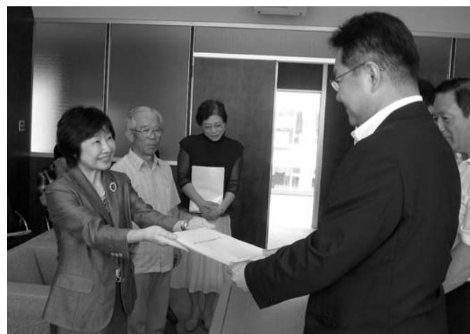
市民の意見を集約した条例の素案を提出「男女共同参画」

◎行政経営における自立の取り組み 年々増加傾向にある未収金の徴収率の向上と縮減は、市民負担の公平性の確保と市財政の健全化の観点から極めて重要な課題です。