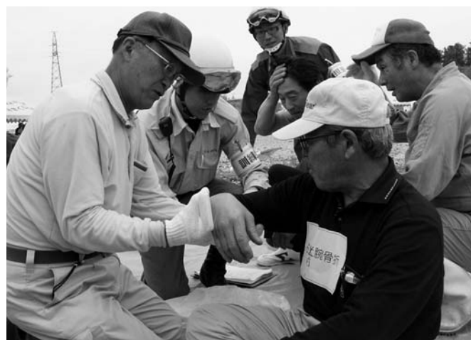
災害時における「共助」の中核となる「自主防災組織活動」

また、就業形態や生活スタイルの多様化に対応し、身近なコンビニエンスストアの端末機でも「住民票の写し」と「印鑑登録証明書」が取得できるよう、平成23年度内にシステムの導入を図り、利便性の高い行政サービスの提供に取り組んでいきます。