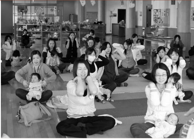
豊かな子育て環境をサポートします「赤ちゃんサロン」

行政それぞれが「自立」「自助」「共助」「公助」の円滑な連携を進め、これからの時代を乗り越える地域力を蓄えていかなければなりません。 ◎協働のまちづくり 「地域のこと、地域で話し合い、責任を持つて実践する」という地域内分権の考え方