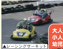
▲レーシングサーキット

大人 (高校生以上) 320円 小人 (小・中学生) 110円 幼児まで 入園無料