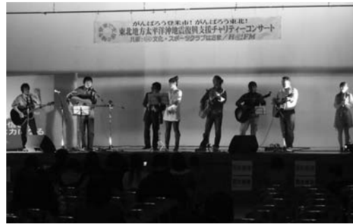
コンサートに参加したアーティストの皆さん

東日本大震災被災者への応援や被災地域の復興を支援する事を目的として4月17日、市迫体育館で地元を中心に活躍しているアーティストによる震災復興チャリティコンサートが開催されました。