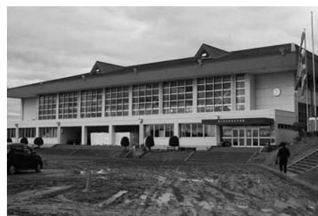
津山若者総合体育館 (津山)