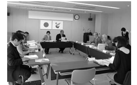
【男女共同参画条例策定委員会】