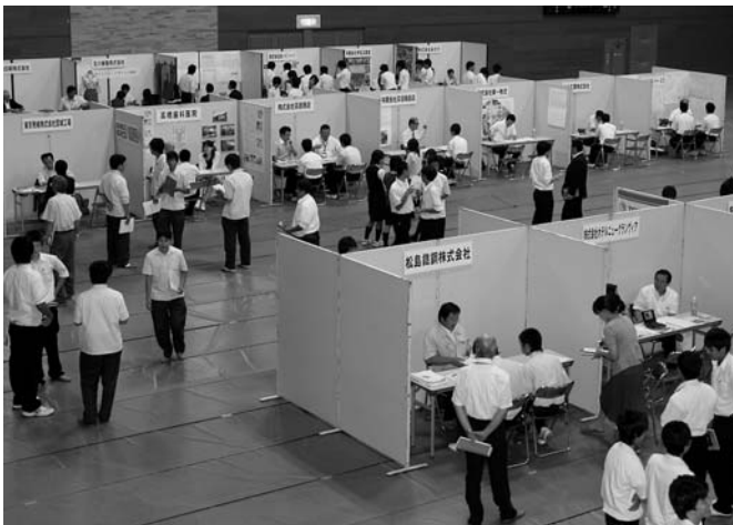
学生・生徒の市内企業への就職をサポート「企業ガイダンス」

さらに、現下の厳しい雇用情勢に対応するため、「緊急雇用対策事業」など4事業により、市内各事業所などで計288人の雇用対策を実施していきます。 長沼工業団地は22年度中に売却を終える見込みであることから、今後は小学