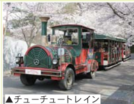
▲チューチュートレイン