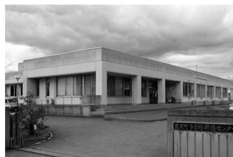
豊里多目的研修センター (豊里)