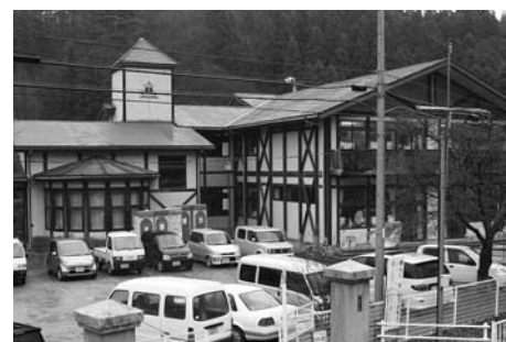
旧鱒淵小学校 (東和)