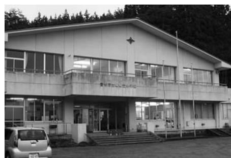
旧嵯峨立小学校 (東和)