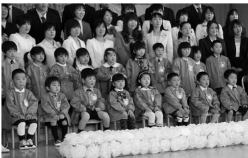
みんなと一緒に記念写真(新田幼)