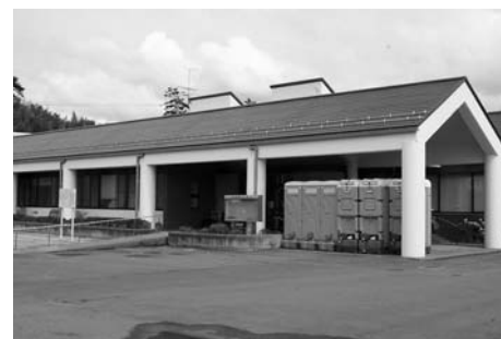
迫保健センター (迫)