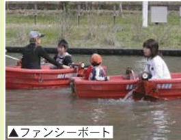
▲ファンシーボート