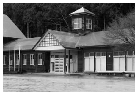
東和国際交流センター (東和)