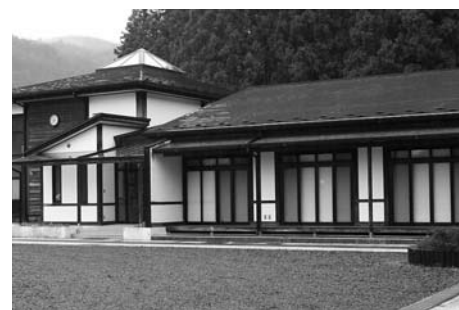
及甚と源氏ポータル交流館 (東和)