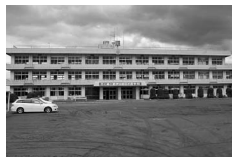
旧善王寺小学校 (米山)