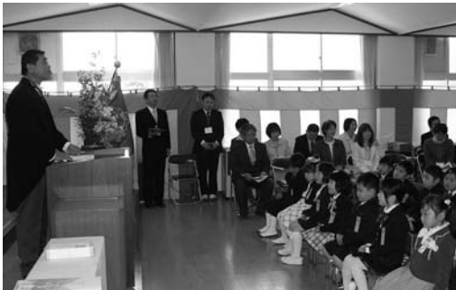
校長先生と学校でのお約束をしました(米川小)

今年度は東日本大震災とその余震により各学校で入学式が延期され、4月15日に入学式が行われた米川小学校では、新入学児童が、元気いっばいに保護者と初登校をしました。