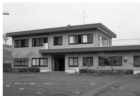
ふるさと交流館 (迫)