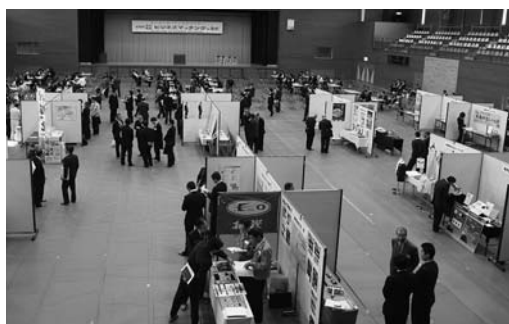
登米・栗原両市から発注・受注会社110社が参加