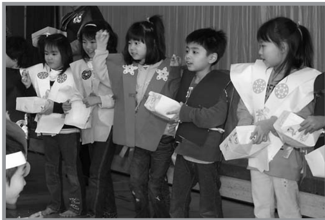
▲みんなで「鬼は外、福は内」と元気に心の鬼を退治しました

中田保育所で2月3日、豆まき会が行われました。会では、最初に節分の由来を聞いたり、みんなで歌を歌ったりした後、園児が楽しみにしていた先生による劇が披露されました。劇では、体の中に「いじわる鬼」や「泣き虫鬼」がいて困っている動物たちに、園児が豆をまいて鬼を退治しました。その後、園児たちが元気に「鬼は外、福は内」と掛け声を掛けながら豆をまき、自分の心の中にある鬼を退治しました。豆まきの後は、まいた豆を一緒に拾い、みんなで仲良くおいしく食べました。