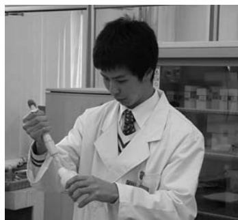
50項目にもわたる水質検査

水道事業所では、市民の皆さんに安全で質の高い水を届けるため、水道水の品質検査を定期的に行っています。検査は、「平成22年度水質検査計画」に基づき、浄水場や市内19カ所の給水栓（蛇口）を中心に、50の基準項目と水源である北上川や迫川の水質検査を実施しました。その結果、全項目で水道法に定められている基準値以下となり、安全で安心な水であることが確認されました。また、水質管理目標設定項目や要検討項目でも、目標値以下となっています【表】。