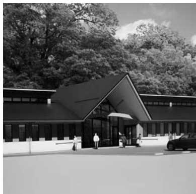
【登米診療所完成イメージ】