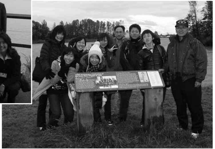
▼フレーザー川河畔にある登米市ゆかりの「及甚記念碑」前で【カナダ】