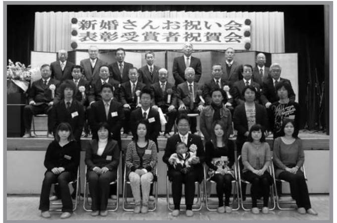
▲新婚さんを祝う会・表彰受賞者祝賀会に参加した皆さん

中津山公民館で2月6日、平成23年新婚さんお祝い会・表彰受賞者祝賀会が開催されました。この行事は、平成22年中に結婚した米山地域の夫婦と春の叙勲・褒賞、宮城県文化の日表彰で受賞した人が対象で、地域のめでたい事を盛大に祝福しようと開催されたものです。会には新婚さん6組と受賞者2人が参加し、地元「清水バンド」による演奏会や婦人会による舞踊などのほか、カラオケやビンゴ大会などが行われました。新婚さんと受賞者の皆さんは、地域からの祝福を楽しみながら時間を過ごしました。