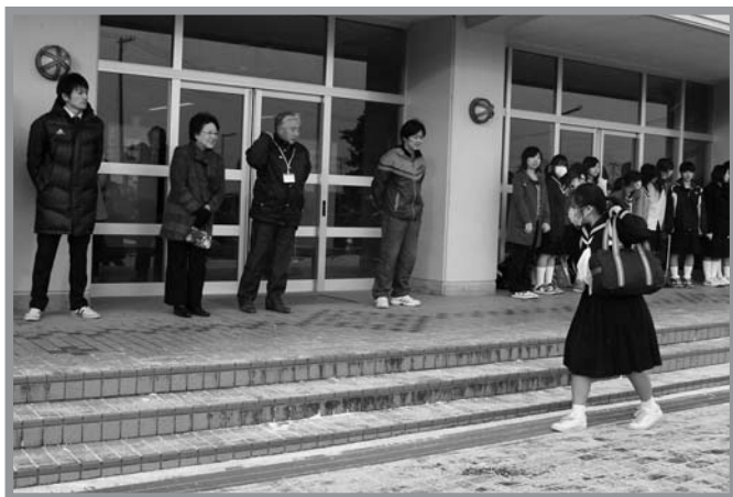
▲多くの皆さんが参加し、活動を続けている「朝のあいさつ運動」

佐沼中学校では、登校時に互いに元気よくあいさつする事で、生徒が明るく元気に過ごせるようお願いを込めて3年前から「朝のあいさつ運動」を実施しています。1月19日には地区民生委員の皆さんも声掛けに参加し、生徒は元気にあいさつしながら登校していました。この運動は、生徒会と教職員、PTA役員や地域の皆さんが協力して行っていて、活動を通して「佐中サポーター」というボランティア団体が組織されるなど、学校と地域が協力して青少年の健全育成に努めています。