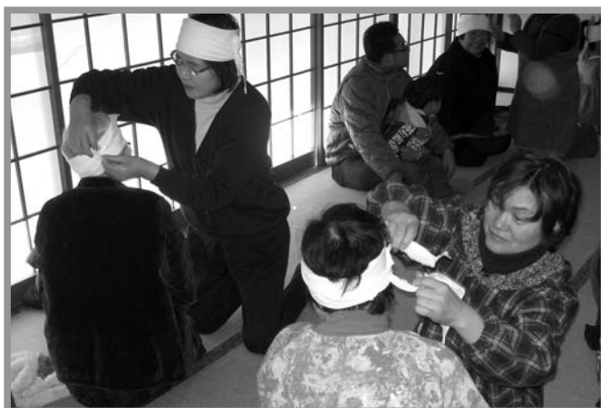
▲いざという時に備え、真剣に応急救護を訓練する皆さん

第57回文化財防火デーに伴い1月23日、津山町石貝の道祖神薬師如来で防災訓練が実施されました。訓練は、となりの倉庫からの出火したという想定で、石貝自主防災組織・津山支部婦人防火クラブ員による初期消火訓練や負傷者への応急救護訓練、また登米市消防団津山支団によるポンプ車での火災防御訓練と、それぞれ災害の状況に応じた各種訓練を行いました。今回の訓練では、貴重な文化財に対する火災予防対策や、いざという時の対応の仕方を再確認するなど大変有意義な訓練となりました。