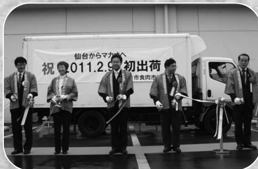
▲仙台市長らとともに初出荷を祝いテープカット

仙台牛をマカオ（中華人民共和国マカオ特別行政区）へ輸出する準備を進めてきた仙台市食肉市場で2月9日、初出荷式が開催されました。輸出される牛肉は、仙台牛の主産地である登米市産の牛肉が選ばれ、初となる今回は「仙台牛」約1頭分（320kg）および「宮城日高見牛」約1頭分（320kg）がマカオに向けて輸出されました。