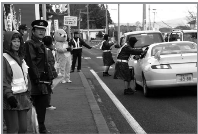
▲雪が舞う寒い日でしたが、多くの皆さんが協力して交通安全をPR