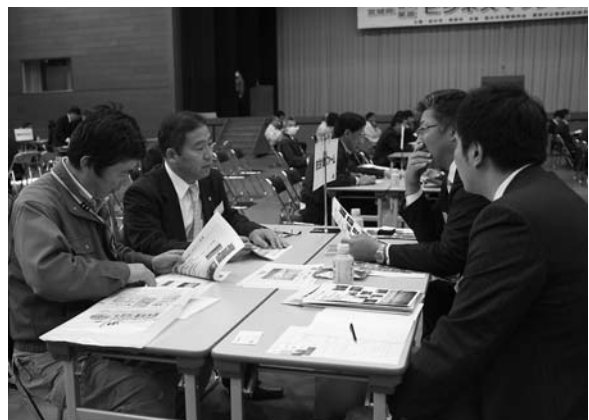
商談ブースで各受注企業が自社の商品や会社をPR

開会セレモニーでは、布施市長が「登米・栗原両市の生産力向上のためにも、この事業をきかっけとして、生産・販売ネットワークの構築や新たなビジネスパートナーを見つけるなど、受注拡大へ向けた取り組みが進むことを期待します」とあいさつしました。