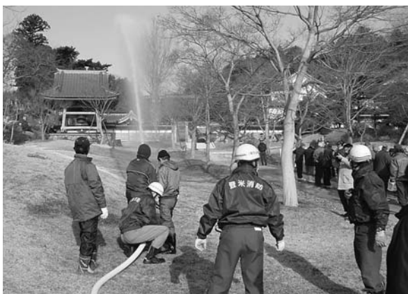
地域住民が協力しての迅速な放水訓練が実施されました

昭和24年に世界最古の木造建築物である法隆寺の金堂壁画が火災によって消失したことを教訓に、文化財を火災・震災などの災害から守るため、定められた文化財防火デー（1月26日）にちなみ、1月29日、県指定有形文化財の山門などを有する豊里町の「月輪山香林寺」で防災訓練が実施されました。