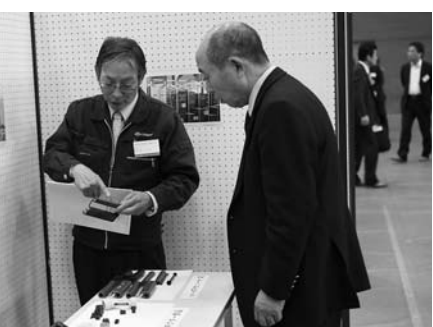
展示ブースで商談や情報交換を行う参加企業

今回は栗原市と共同で開催され、首都圏からの3社を含め、発注企業29社、両市から受注企業81社が参加するなど、会場は多くの参加者でにぎわいました。