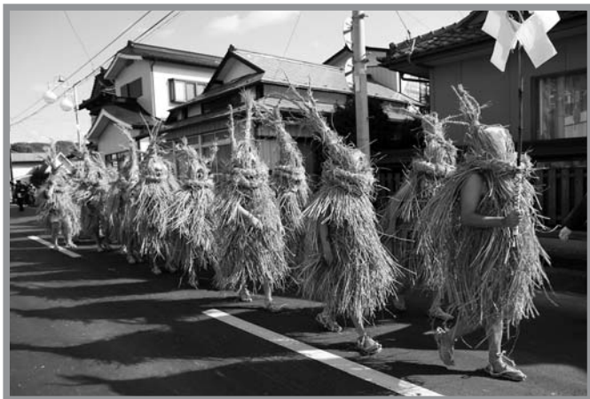
▲神様の使いになるため、秋葉山大権現に向かう男たち

国の重要無形民俗文化財に指定されている「米川の水かぶり」が2月8日に米川の市街地で行われました。この祭りは米川五日町地区に古くから伝わる火伏せ行事で、地区の男たちがわら装束に身を包み神様の使いとして、家々に水を掛けて火伏せを祈願します。また、身に付けているわらを抜き取り、屋根に上げると火伏せのお守りになるとも伝えられていて、水をかぶりながらもわらを抜き取ろうとする子どもたちや勇壮に練り歩く男たちの姿を写真に納めようとするカメラマンで沿道はあふれていました。