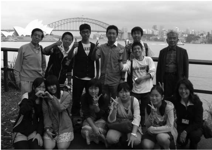
▲シドニーにある20世紀を代表する近代建築物オペラハウスをバックに【オーストラリア】