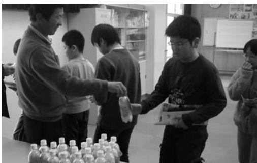
全員に環境保全米をプレゼント【泉区 桂小学校】

市内の農家が講師となり環境保全米の魅力や農業の大切さなどを伝える出前講座が1月20日から2月4日まで、仙台市内の7つの小学校で開催されました。この出前講座は、市が取り組む「登米産米販路拡大事業」の一環として開催されたもので、都市部の子どもたちにも農業に関心を持ってもらい、登米産のコメの消費拡大にもつなげていこうと仙台市教育委員会を通じて「出前先」を募り開催されたものです。講師は、みやぎ登米農協南方町水稻部会の役員が交代で務め、アイガモ農法や冬期湛水田など、農薬や化学肥料を極力使わない米作りの様子やメダカやカブトエビなど多様