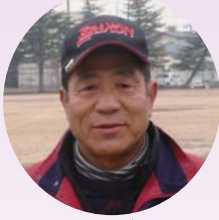
迫町ターゲット・バードゴルフ協会