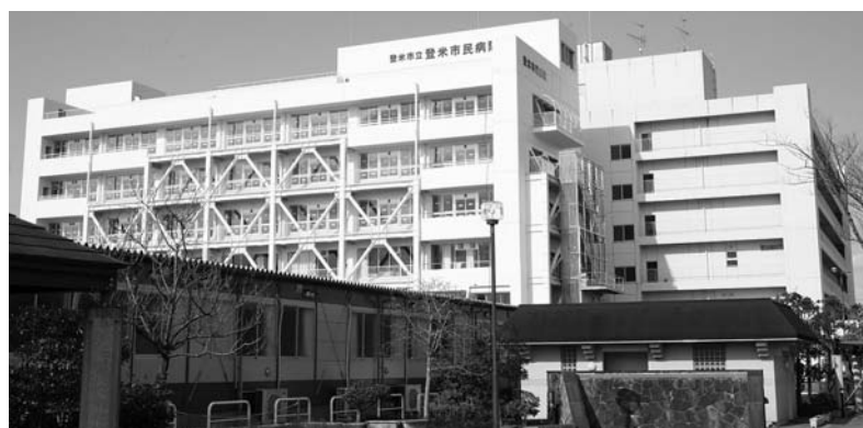
人に優しい質の高い医療を提供します【登米市民病院】

市立病院では、これまでにもさまざまな形で病院事業の経営改善に向けた取り組みを行ってきましたが、4月1日から次のとおり病院の名称や診療科目などを変更し、更なる医療提供体制の向上を目指します。