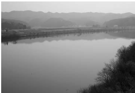
わたしたちの大切な水源【北上川】