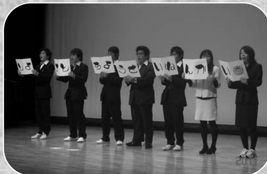
▲豊里町青年会による素晴らしい合唱の披露

第6回登米市青年文化祭が1月30日、豊里公民館を会場に行われました。この大会は、日ごろの文化活動の発表を通して、活動の活性化を目的として開催され、通算で55回目の開催となった今大会は、市内の各青年会による郷土芸能や合唱などの発表のほか、大会企画として豊里町ゆかりの釜神様にちなんだ、巨大紙芝居の披露も行われました。