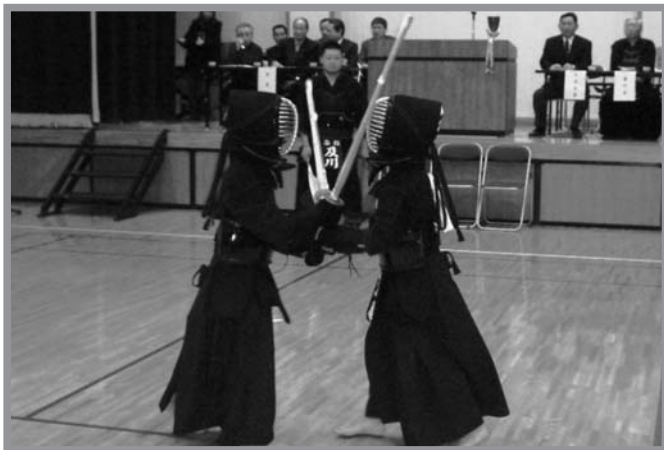
▲張り詰めた空気の中、日ごろ鍛えた腕を競い合う剣士たち