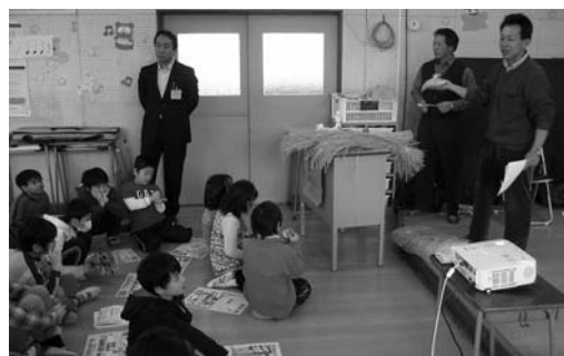
米の作り方を分りやすく説明【青葉区 片平丁小学校】

な生き物の生息状況について説明がされました。講座終了後には、環境保全米が1人に3合ずつ贈られ、児童は環境に優しい米について理解を深め、米作りにも関心を持った様子でした。