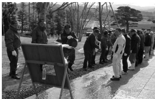
バケツリレーでの初期消火訓練