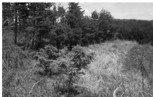
今後村田製作所によって整備される西綱木の里山林

協定を結んだのは(株)登米村田製作所(追)と米川生産森林組合(東和)で、平成28年3月までの5年間にわたる組合の所有する里山林の整