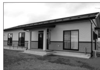
▲沢田行政区で整備した集会施設「沢田公民館」

この事業は、財団法人自治総合センターが宝くじ受託収入を財源に、コミュニティ組織などの健全な発展と宝くじの普及広報を目的として実施しています。