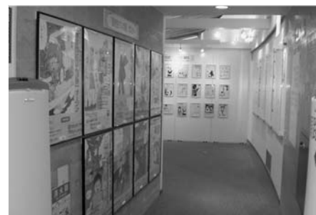
▲昨年も高校生の力のこもった作品がたくさん展示されました。