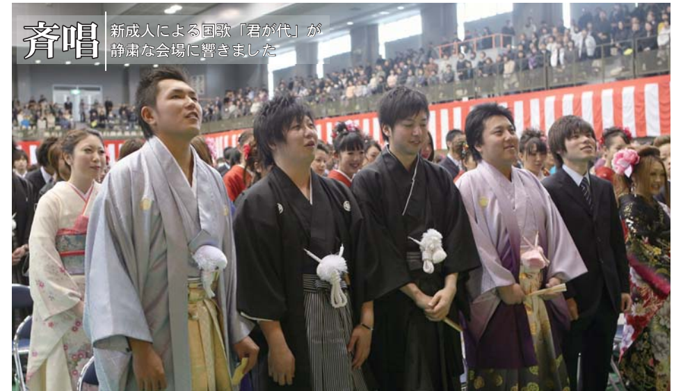
斉唱 新成人による国歌「君が代」が静かな会場に響きました