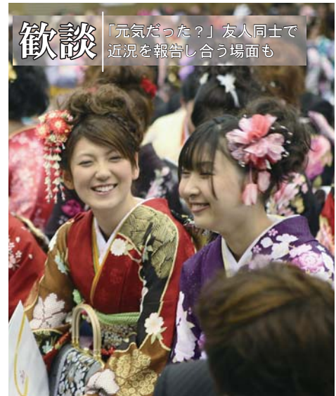
歓談 「元気だった？」友人同士で近況を報告し合う場面も