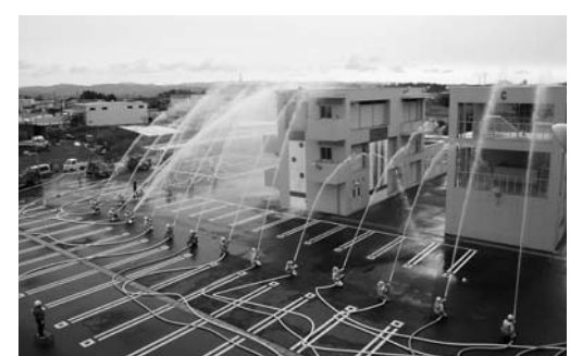
消防団員による一斉放水訓練

今年一年も職務を遂行できるよう士気を高めていました。 また、翌日の9日には市消防団出初め式が消防防災センターで実施され、9支団の団員や市関係者ら約1300人が参加しました。 各支団の団員は、人員報告後、センター前で規律正しい観閲行進を行い市長が観閲しました。 市長は告辞で「火災から生命や財産を守るためには、消