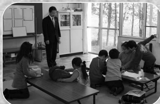
▲放課後子ども教室の活動の様子を視察する市長

市長が活動現場に出向き、視察や意見交換を行う「移動市長室」が1月18日、浅水小学校で開催されました。当日は、放課後子ども教室の協力スタッフなどが参加し、放課後における子どもたちの健全な過ごし方や、安全管理などについて積極的な意見交換が行われたほか、市長が放課後子ども教室での子どもたちの様子を見学しました。