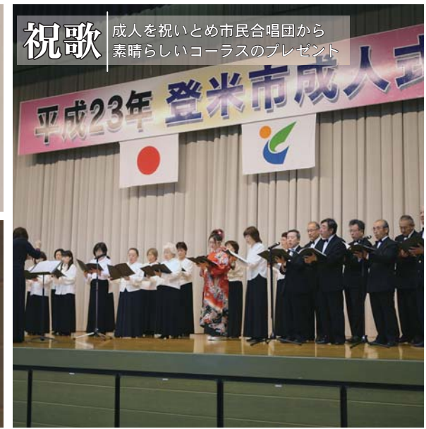
祝歌 成人を祝いとめ市民合唱団から素晴らしいコーラスのプレゼント