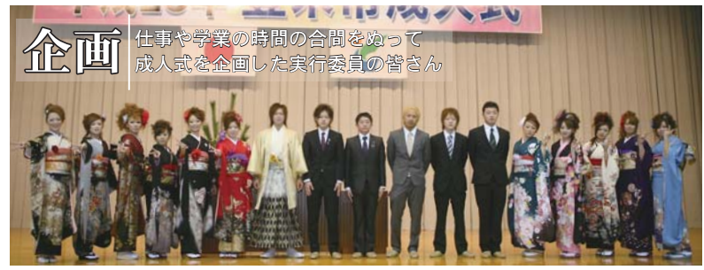
企画 仕事や学業の時間の合間をぬって成人式を企画した実行委員の皆さん