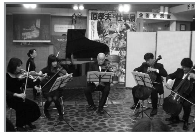
▲幻想的な雰囲気の中、ホールには優雅な音色が響き渡りました