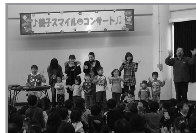
▲あきらちゃん＆ラーメンちゃんの音楽に合わせて、楽しくダンス

親子で歌を歌ったり、演奏を聴いたりして、子どもと保護者が音楽を共に楽しむ「親子スマイルコンサート」が1月14日、豊里子育てサポートセンターで開催されました。これは、豊里保育園と子育てサポートセンターの共同で開催されたもので、今回は、仙台市のアトリエ自由楽校から「あきらちゃん＆ラーメンちゃん」を迎えてのコンサートを行いました。コンサートには約230人の親子が参加し、親子で音楽に合わせて体を動かしたり、歌にあわせて手遊びをしたりと、楽しい時間を過ごしました。