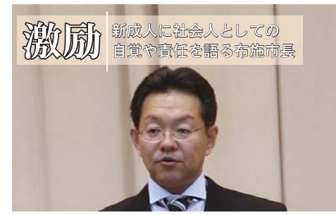
激励 新成人に社会人としての自覚や責任を語る布施市長