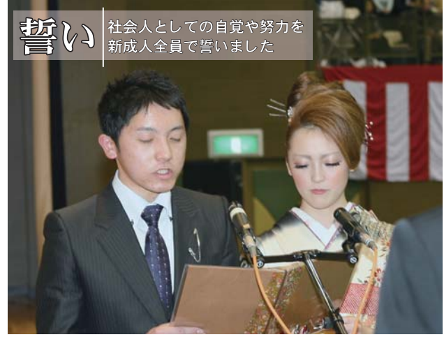
誓い 社会人としての自覚や努力を新成人全員で誓いました