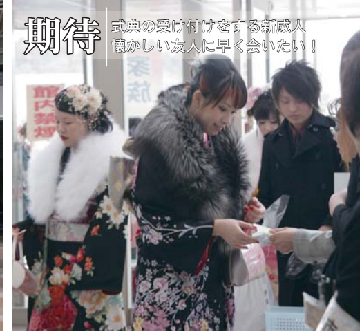
期待 式典の受け付けをする新成人 懐かしい友人に早く会いたい!