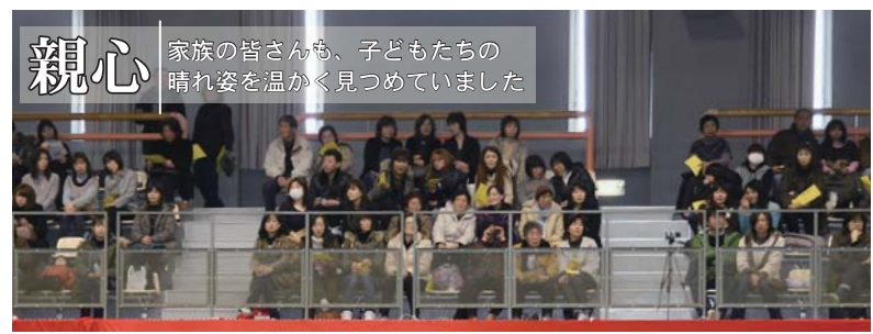
親心 家族の皆さんも、子どもたちの晴れ姿を温かく見つめていました