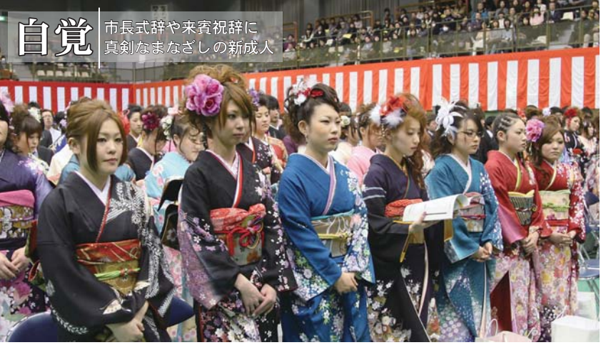
自覚 市長式辞や来賓祝辞に真剣なまなざしの新成人