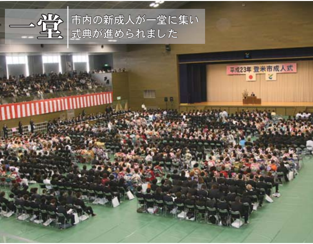
一堂 市内の新成人が一堂に集い式典が進められました