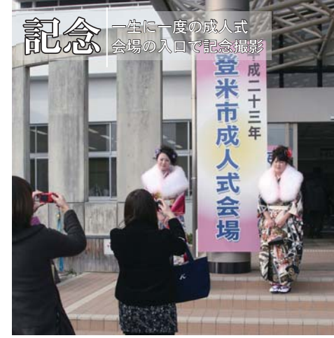
記念 一生に一度の成人式 会場の入口で記念撮影