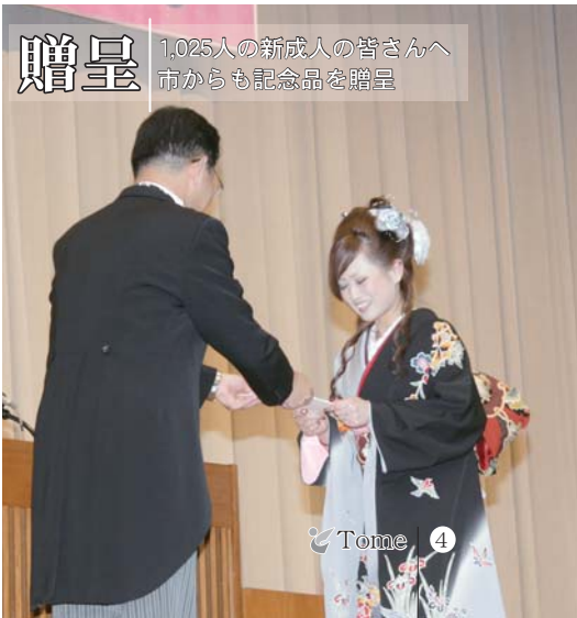
贈呈 1,025人の新成人の皆さんへ市からも記念品を贈呈