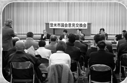
▲議会の在り方に対して、多くの意見が出された交換会

市民に開かれた議会を目指し検討を重ねてきた「議会基本条例」に対する意見交換会が、市内9カ所で開催されました。これは議会の在り方を定める条例の制定に向けて、広く市民の意見を聞くため開催されたものです。迫地区では1月18日迫公民館で開催され、条例内容について多くの意見が出されるなど、活発な意見交換が行われました。