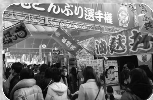
▲丼店舗がズラリと並び、大勢の人でにぎわう会場

日本各地の名物どんぶりを集め、その味を競う「全国ご当地どんぶり選手権」が1月8日から東京ドームで開催されました。第2回となる今回は、全国から20チームがNo.1の座を目指して9日間に渡って熱闘を繰り広げました。登米市からは昨年に引き続き、登米油麩丼の会の皆さんが油麩丼を出品し、登米市の名物「油麩丼」を全国にPRしました。