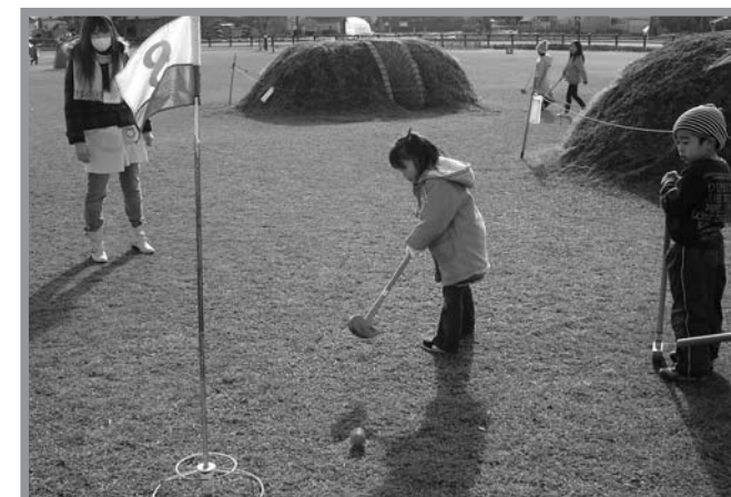
▲寒さに負けず、元気にグラウンドゴルフを楽しむ子どもたち

米谷・錦織・米川児童クラブの児童が中田町の諏訪公園で1月5日、所外体験学習としてグラウンドゴルフを行いました。初めてのグラウンドゴルフでは、最初はうまくボールに当てることができませんでしたが、なかだスポーツクラブ「パティオ」のスタッフから握り方や構えを教えてもらおうと、すぐに上達し、中にはホールインワンを出す児童もいました。当日は冷たい風が吹き付ける寒い日でしたが、子供たちは顔を真っ赤にしながらも元気いっぱいプレーし、初めてのグラウンドゴルフを楽しみました。