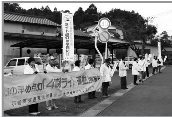
▲交通事故防止を願い、ライトの早め点灯を呼び掛けました

交通事故は、夕暮れ時から夜間の時間帯に多く発生し、特に午後4時から午後6時の時間帯に最も多く発生しています。この現状を踏まえ、12月20、21日の2日間、夕暮れ時の交通事故を石越地区から無くそうと、石越地区の各交通安全団体関係者延べ80人が結集し、石越総合支所入り口前県道沿いで「4時ライト運動」を実施しました。参加者は寒空の下、のぼり旗や横断幕などを掲げて、県道を走行する自動車のドライバーに早めのライトの点灯を呼び掛けました。