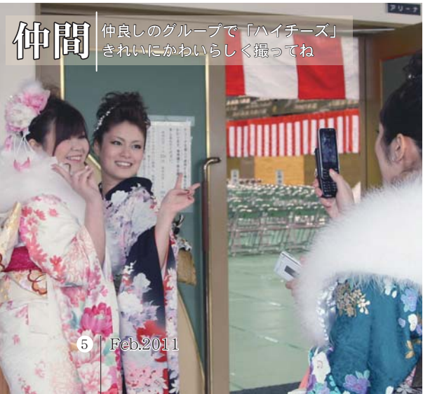
仲間 仲良しのグループで「ハイチーズ」きれいにかわいらしく撮ってね