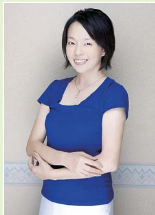
講師 千葉 真子 さん

講師 元陸上競技選手 1997年世界陸上アテネ大会10000m銅メダリスト 千葉 真子さん