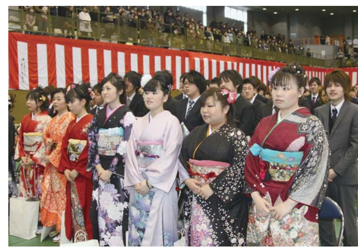
会場の登米総合体育館には各町域の新成人が、スーツや振袖に身を包み一堂に集いました

「成人の日」前日の1月9日、登米市成人式が登米総合体育館で開催されました。 今年の成人式は、昨年より22人少ない1025人(男515人、女510人)が対象。このうち、式典には晴れ着やスーツに身を包んだ866人の新成人が出席しました。 開式前、旧友との再会を喜ぶ声が響く一方、式典では大人としての自覚を真剣な表情で受け止めていました。