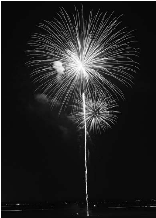
色とりどりの大輪の花火が、冬の夜空を彩る【石越】

小正月（1月14日）に正月飾りを焼き、燃え上がる御神火にあたることでその年の無病息災、五穀豊穡、商売繁盛などを祈る伝統行事「どんと祭」が1月14日、市内の各神社などで行われました。 迫地区では、津島神社を主会場としてたき上げのほか、白鉢巻きに白サラシを巻いた姿で御神火を目指して参拝する「裸参り」などが行われました。