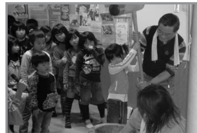
▲きねと臼を使ったもちつきに、興味津々の子どもたち

地域の交流を目的に、子育てサポートセンターと南方児童クラブ保護者会が共催で行っている、昔ながらのきねと臼を使ってもちをつく「もちつきペタン」が1月15日開催され、赤ちゃんから大人まで約130人が参加しました。子どもたちは初めて見るきねと臼に戸惑いながらも、大喜びでもちつき体験をしていました。調理は、南方農村生活研究グループ連絡協議会の協力をもらい、あんこもちやお雑煮、にらツナもちなど4種類のもちが振る舞われ、みんなとてもおいしそうに食べていました。