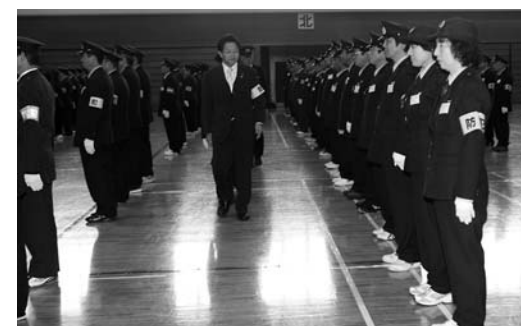
防犯指導隊員一人一人の服装を点検する市長

市防犯指導隊と交通安全指導隊の平成23年出初め式が1月8日、中田総合体育館でそれぞれ開催されました。 式には、市民の安全・安心確保のため、日々活動している市内各地区の防犯指導隊員、交通安全指導隊員が参加し、点呼や服装点検、各隊長からの訓示などが行われました。 参加した隊員は、市民の皆さんが安全で安心して暮らせる「登米市」の実現に向け、