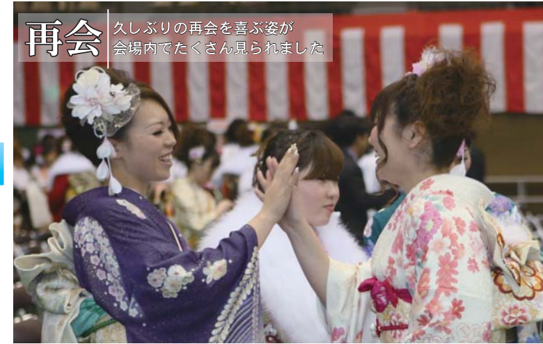
再会 久しぶりの再会を喜ぶ姿が会場内でたくさん見られました