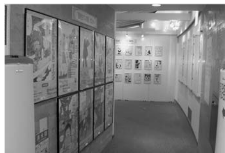
▲昨年も高校生の力のこもった作品がたくさん展示されました。