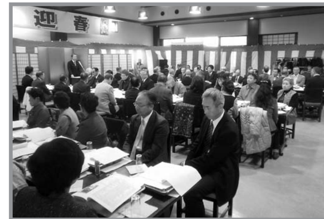
▲地区の事業所・団体などの関係者が参加し、新年を祝いました

登米町新春懇談会（新春懇談会実行委員会主催）が1月7日、とよま観光物産センター「遠山之里」で開かれ、地元の事業所や行政関係団体などから約90人が参加しました。懇談会では、市制5周年を記念し登米市の「花（さくら）鳥（はくちょう）木（すぎ）」の制定や三陸縦貫自動車道登米東和ICの開通、9年間継続している死亡事故ゼロ記録、新登米診療所の建設と特別養護老人ホームの新設などを話題に親睦を深め、登米地区がさらに飛躍できるよう抱負を語り合いながら、気持ちを新たにしていました。