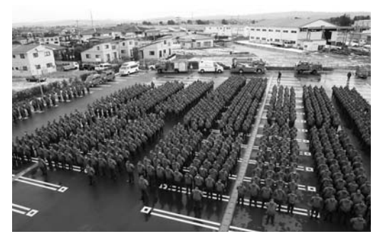
市民の命や財産を、火災から守る消防団の皆さん

市防犯指導隊と交通安全指導隊の平成23年出初め式が1月8日、中田総合体育館でそれぞれ開催されました。 式には、市民の安全・安心確保のため、日々活動している市内各地区の防犯指導隊員、交通安全指導隊員が参加し、点呼や服装点検、各隊長からの訓示などが行われました。 参加した隊員は、市民の皆さんが安全で安心して暮らせる「登米市」の実現に向け、