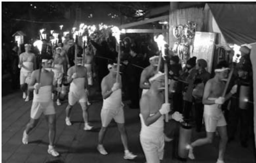
毎年大勢の人が参加し、御神火を目指す裸参り【迫】