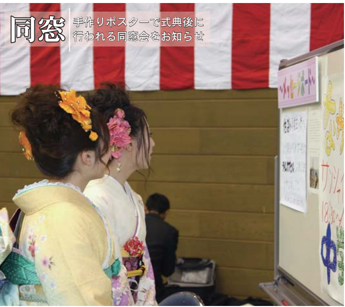
同窓 手作りポスターで式典後に行われる同窓会をお知らせ