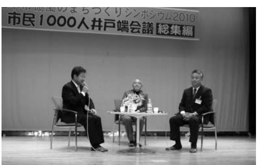
まちづくりに関する意見を交わす市長と委員の皆さん

られました。 その後は、井戸端会議総集編として、来場者が登米市の「地域」「人」「産業」のテーマごとのグループに別れ、活発な意見交換や話し合いが行われました。