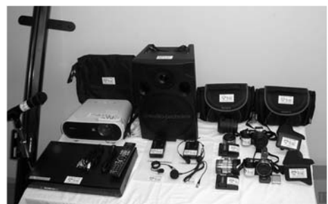
▲消防本部で整備した視聴覚機材など

データプロジェクター、自立型スクリーン、ブルーレイディスク/DVDレコーダー、ワイヤレスアンプシステム、デジタル一眼カメラ、デジタルビデオカメラ、インクジェットプリンターほか