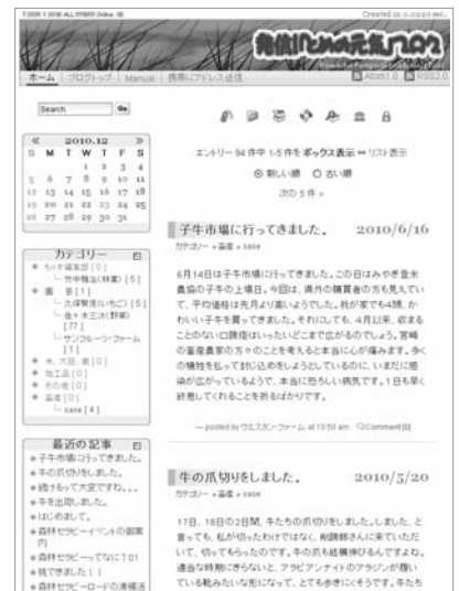
▲とめの元気ブログのイメージ

総務部市長公室 広報広聴係 ☎ 0220 (22) 2090 ✉ koho@city.tome.miyagi.jp