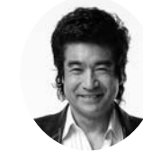
▲仮面ライダーを演じた藤岡弘、さん

ゲスト：藤岡弘、さん（俳優「仮面ライダー」主演） 村枝賢一さん（漫画家、代表作「仮面ライダーSPIRITS」）