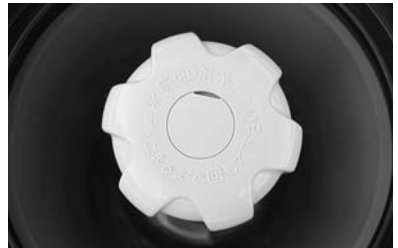
▲水抜栓で水を抜くのを忘れないようにしましょう。