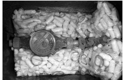
▲保温材を入れ保温しましょう。