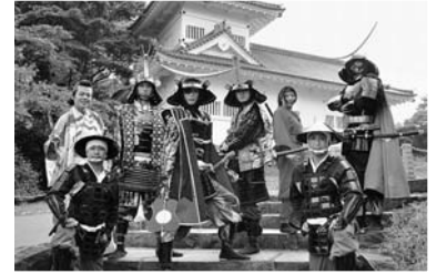
▲当日は、仙台で大人気の奥州・仙台おもてなし隊『伊達武将隊』も応援にきます！

【日時】 12月5日(日) 午前10時～午後2時 【場所】 中江中央公園 (市役所迫庁舎前)