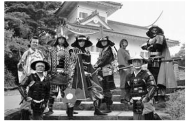
▲当日は、仙台で大人気の奥州・仙台おもてなし隊『伊達武将隊』も応援にきます！

【問い合わせ】 第7回日本一はっとフェスティバル実行委員会事務局（産業経済部商工観光課内） ☎ 0220 (34) 2734