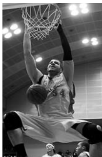
▲クリス・ホルム選手の力強いダンクシュート