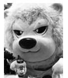
▲マスコットキャラクター「ティナ」