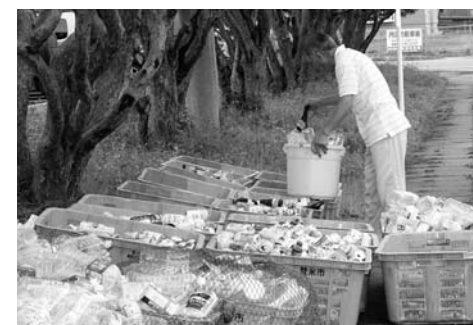
ごみはきちんと分別し、貴重な資源をリサイクル