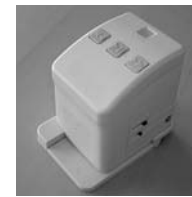
(※1) 活字文書読み上げ装置

このように音声コードは、紙の情報を「読む」ものから、「聞く」ものにし、これまで活字文書からの情報入手が困難だった視覚障害者や高齢者も、紙媒体から情報を得ることができるようになります。