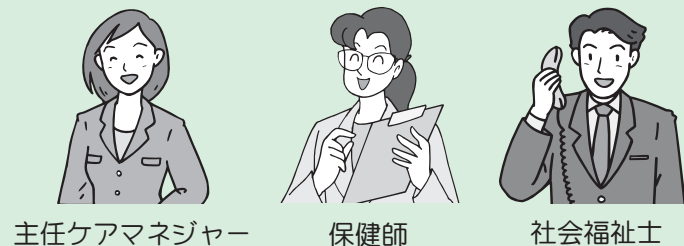
主任ケアマネジャー 保健師 社会福祉士

地域包括支援センターでは、主任ケアマネジャー、保健師、社会福祉士などが中心となって高齢の皆さんの支援を行います。それぞれ専門分野の仕事だけ行うのではなく、互いに連携をとりながら「チーム」として総合的に皆さんを支えます。