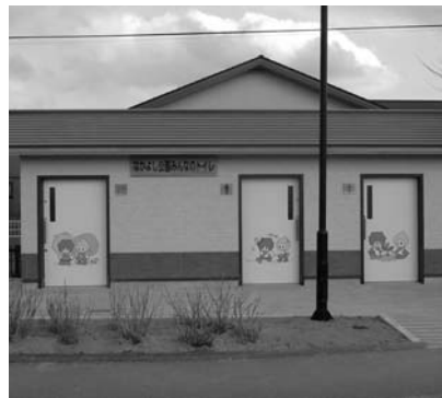
▲新設された「なかよし公園（中田）」のトイレ

「みんなのトイレ」ができました 1月から都市公園3カ所において工事を進めてきました新しい公衆トイレが完成し、4月1日から使えるようになりました。