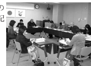
▲策定委員会で条例について検討している様子