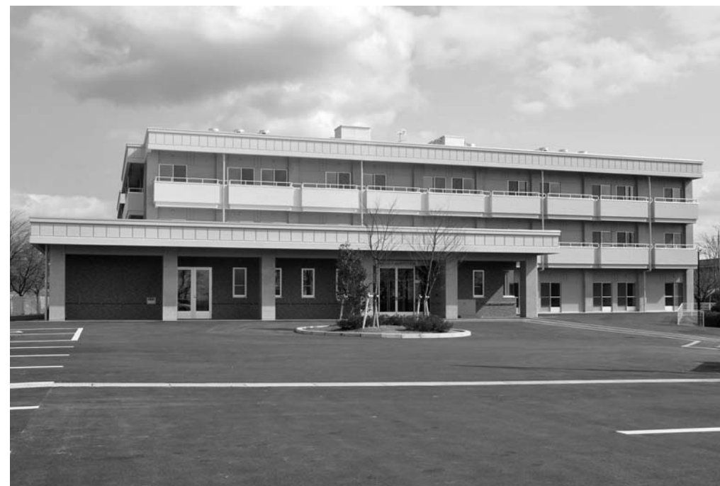
▲旧水道事業所跡地に完成した「きたかみ園」