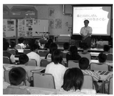
横山小学校の環境出前授業の様子

市では、市の環境について多くの人に関心を持ってもらうため、宮城教育大学と「環境に関する連携協力協定」を締結し、宮城教育大学環境教育実践センターの協力のもと、さまざまな事業を行い、環境教育の充実を図っています。 この事業は、全国モーターボート競走施行者協議会の助成を受け実施されたもので、昨年度は、「登米市環境教育指導者研修会」や「登米市環境出前授業」などの事業を実施し、環境保全活動に関心のある人や市内の小学校、中学校の生徒など、約300人が各事業に参加して、環境について学びました。