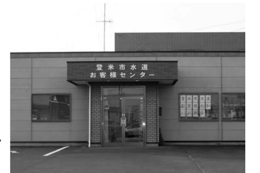
▲4月1日から業務を開始する登米市水道お客様センター