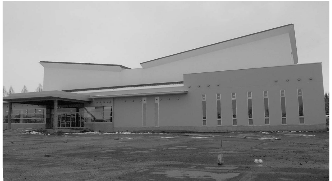
▲複合施設として完成を目指す豊里公民館・豊里総合支所

【問い合わせ】 豊里総合支所 代表 ☎ 0225 (76) 4111 ・ 豊里公民館 ☎ 0225 (76) 2237