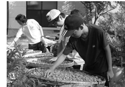
▶昨年の宿泊農業体験の様子。苗植え体験（左）と梅の天日干し体験（右）