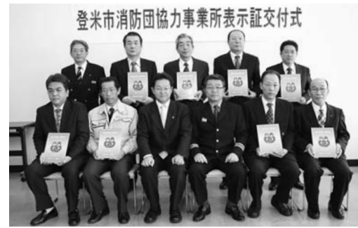
協力事業所として認定された8団体の代表の皆さん

初めての表示証交付式となった今回は、認定を受けた8事業所の各代表が出席し、市長が表示証を交付しました。交付後市長は「日ごろから社員の消防団勤務などについて配慮いただき感謝します。災害発生時には、消防団など地域の協力が一番大切です。皆さんの取り組みを広く市民に周知するとともに、一層の協力を体制を築いていきたいと思います」と感謝とお願いの言葉を述べました。