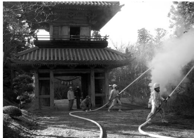
消防団員による迅速な放水訓練が実施されました

大切な文化財を火災から守る 文化財防火デー防災訓練・文化財講座 昭和24年に世界最古の木造建築物である法隆寺の金堂壁画が火災によって消失したことを教訓に、文化財を火災・震災などの災害から守るため、定められた文化財防火デー（1月26日）にちなみ、1月24日、県指定文化財などを多く所有する東和町の「竹峯山大