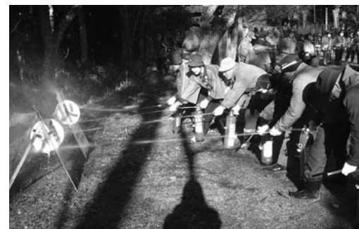
訓練用消火器を使っでの初期消火訓練

訓練は、華足寺北西側の山林から出火し、本堂へ延焼する恐れが生じた想定して進められ、一般電話からの通報訓練や駆けつけた住民による重要物の搬出、などの訓練が実施されました。また、地域住民による通報訓練や消火器やバケツリレーでの消火訓練、消防団による中継・単独放水なども実施され、参加した皆さんは各訓練に真剣に取り組