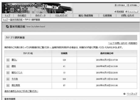
▲リニューアルした「交流掲示板」です。