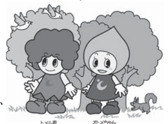
登米市環境キャラクター