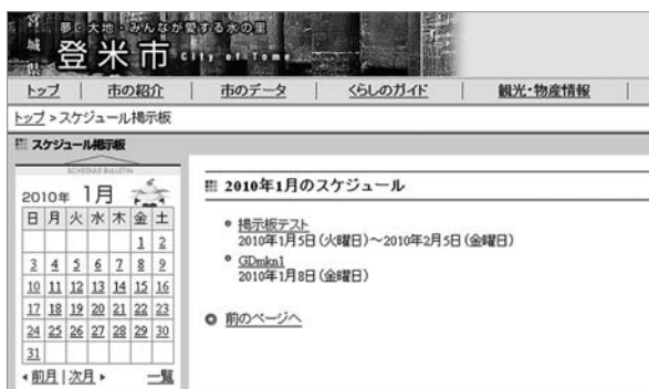
▲市のイベント・行事をカレンダー形式で表示するページを新しく、市ホームページに作成しました。