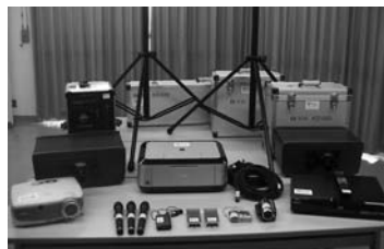
▲横山地区コミュニティ推進協議会で整備したオーディオ機器など