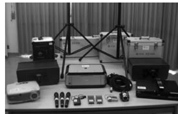
▲横山地区コミュニティ推進協議会で整備したオーディオ機器など