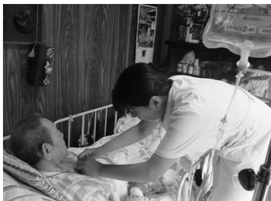
自宅で点滴を受けることができます

このほか、在宅医療を支える取り組みとして、医師が患者の求めに応じて自宅へ出向き、診療を行う往診と医師が定期的に自宅を訪問し、診療を行う訪問診療があります。往診と訪問診療の違いは、患者の自宅に行く予定があったか、予定外の訪問だったかの違いになります。そして、医師の診断の結果治療が必要と判断された場合に自宅へ看護師が訪問し、看護を行う訪問看護というサービスもあります。