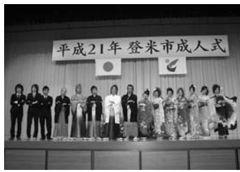
▲昨年の成人式実行委員の皆さん