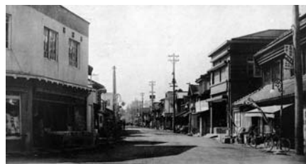
▲戦前の「一市通り」の様子(佐沼名所絵葉書より)