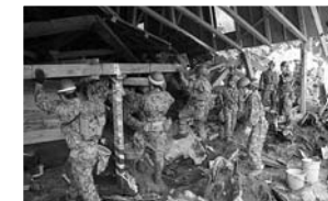
◀駒の湯温泉倒壊現場での作業の様子

※訓練は、10月31日の朝、大規模地震が発生したため、登米市が自衛隊に支援を要請したことを想定して行われます。そのため、自衛隊の皆さんは支援要請の連絡を受けた後、準備をして山形県にある基地を出発します。登米市到着後、訓練開始となるため、開始時間は訓練の進行状況によります。