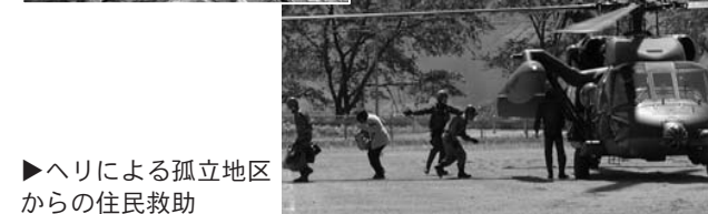
▶ヘリによる孤立地区からの住民救助