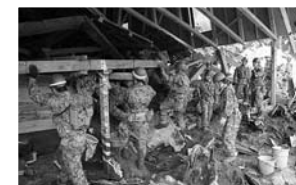
◀駒の湯温泉倒壊現場での作業の様子

※訓練は、10月31日の朝、大規模地震が発生したため、登米市が自衛隊に支援を要請したことを想定して行われます。そのため、自衛隊の皆さんは支援要請の連絡を受けた後、準備をして山形県にある基地を出発します。登米市到着後、訓練開始となるため、開始時間は訓練の進行状況によります。