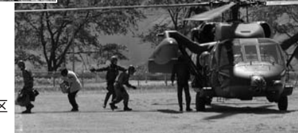
▶ヘリによる孤立地区からの住民救助