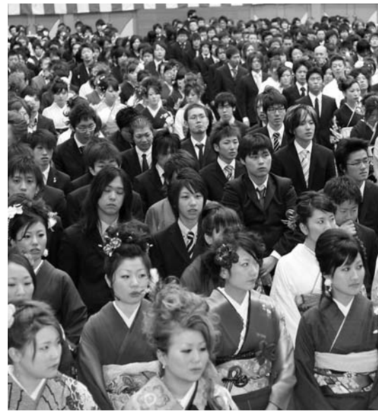
今年の成人式の様子