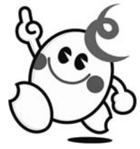
▲市の協働キャラクター「とめ丸」

市で積極的に取り組んでいる「協働のまちづくり」。今月号では、「登米市地域協働ミーティング（対話集会）」の様子と、先月号に引き続き各地域の取り組みについて紹介します。