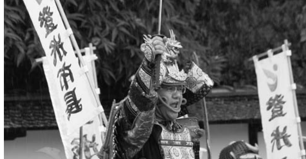
かかし姿で「登米市のデスティネーションキャンペーンいざ出陣！」 と呼ばれるこの祭り。五穀豊穡を祈り法印神楽が奉納されます。 【問い合わせ】 稲荷神社 ☎ 0225 (76) 4578

今年度も、「登米市産業フェスティバル」をはじめ、秋祭りや文化祭・芸能祭が市内各地で開催されます。 また、今月から12月までの3カ月間、県内で開催される「仙台・宮城デスティネーションキャンペーン」に合わせ、 特別イベントなどが盛り込まれるなど、より「登米市らしさ」を感じることができるイベントとなっています。 毎年市内外から大勢の人が訪れ、にぎわう登米市の祭り。今月は市内で開催されるお祭り情報を紹介します。