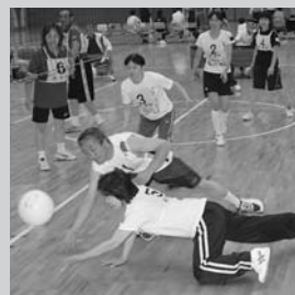
家庭バレーボール