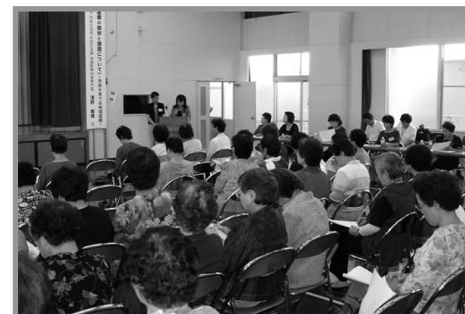
▲迫地区の9つの女性団体から約120人が参加しました

第54回はさま女性のつどいが9月6日、迫公民館で開催され、迫地区の9団体から約120人が参加しました。このつどいは、各団体の交流を目的に毎年開催されているもので、今年は市民生活課の職員を講師に「登米市の地域医療の現状と課題について・市民が育てる地域医療」と題した講演が行われ、地域ケア体制づくりの課題やほかの自治体での取り組みなどが紹介されました。参加者からは「医療や介護に対する地域住民の取り組みについてわたしたちも考えていきたい」といった感想も聞かれました。