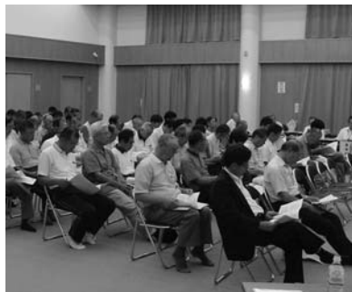
対話集会の様子【中田会場 8月19日】

◆各団体が実施している事業に多くの団体が手を取り合っており、取り組みの中で、大きな力になると思う。視点を変えて取り組むことが協働につながると思う。