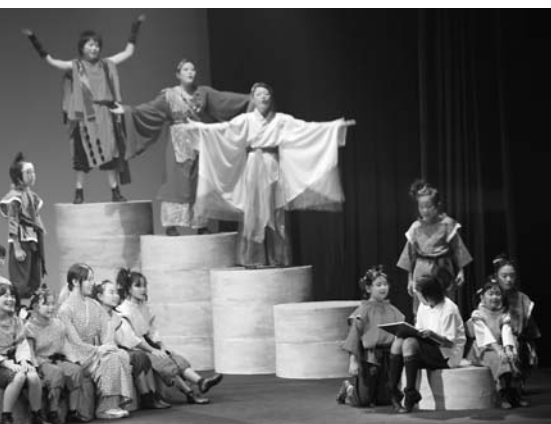
完成度の高い演技に観客はステージにくぎ付けでした

り、登米祝祭劇場で開催されました。 ドリーム☆キッズは、(財)登米文化振興財団が2002年に結成し、現在は小中学生や高校生まで38人が所属しています。