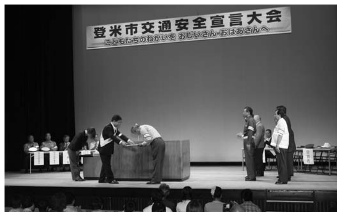
交通安全に功労のあった団体、個人が表彰されました

その後、同協議会長の市長から交通安全への貢献をたたえ、佐沼地区交通安全協会上沼支部、登米小学校および個人に表彰状を授与。また交通安全事故抑止功労として南方の中央地区、登米の寺池地区にも表彰状が送られました。その後、中津山と米谷両小学校の代表児童が「子どもたちの