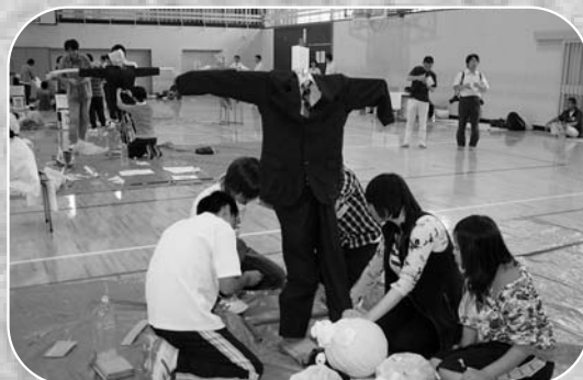
▲協力しながら、思い思いのかかしを作製する生徒

宮城県高等学校定時制・通信制「生徒の集い〜かかしを作ろう!〜」が9月13日、佐沼高校を会場に開催されました。当日は県内から13校の定時制・通信制の生徒たちが一堂に集い、8班に分かれて「高校生活」をテーマにかかしを作りました。生徒は勉強や部活動、アルバイトなどの高校生活の様子を話し合い、工夫を凝らしたかかしを作りました。