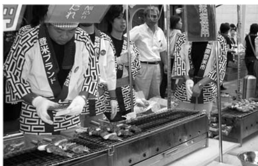
好評だった登米産物の牛くし「麻布十番納涼まつり」

市で生産される安全で安心な農産物などの特産品を、消費者との交流を通して広くPRし、販路を広げようという行事が、東京、仙台、そして地元追で開催されました。 8月22日から24日まで、東京都港区麻布で「麻布十番納涼まつり」(麻布十番商店街振興組合主催)が開催され、全国から自慢の特産品が出店されました。市では生産者、JAと協力し、登米産物の牛くしを販売しました。今回が初