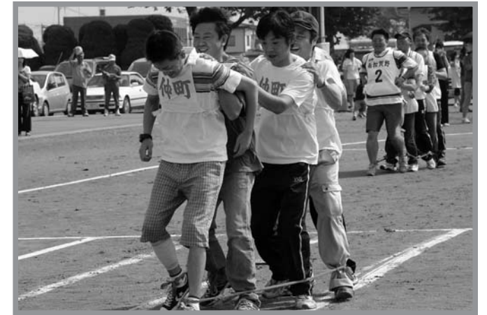
▲掛け声に合わせて進む各チームに会場からは声援が送られていました

第2回石森ふれあい運動会（同実行委員会主管）が、9月14日、石森ふれあいセンターグラウンドで開催されました。当日は天候にも恵まれ、さわやかな秋の風が吹き抜けるなか地区民約630人が参加。工夫を凝らした各種競技に、手に汗握る熱戦が繰り広げられました。応援席のテントからは声援や笑い声があふれるなど観戦していた皆さんも大変な盛り上がりで、スポーツの秋を大いに楽しんだ1日となりました。大会結果は次のとおりです。【優勝】加賀野一区【準優勝】加賀野二区【第3位】南町