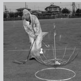
ターゲットバードゴルフ