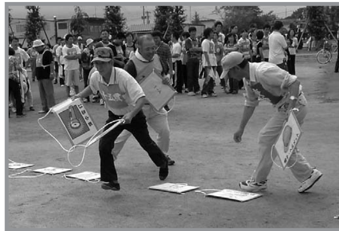
▲災害時に必要な防災用品をリレーする新競技「備えて安心」

豊里地区市民大運動会が9月7日、豊里運動公園で開催され、子どもからお年寄りまでみんなで楽しめる11種目を実施しました。今年度は、豊里支部婦人防火クラブの協力のもと、災害時に役立つ知識を競技に取り入れ、防災用品を描いたカードを選びリレーする競技『備えて安心』などバラエティーに富んだ種目を実施し、応援席からは大きな歓声や拍手が送られ大いににぎわいました。天候はあいにくの曇り空でしたが、競技に参加した皆さんは熱戦を繰り広げ、西二ツ屋町内会が優勝の栄冠に輝きました。