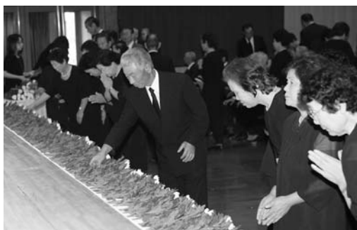
献花して戦没者の冥福を祈る参列者

市戦没者追悼式が8月29日、登米祝祭劇場で行われ、遺族や関係者ら約500人が参列しました。 式の初めに、太平洋戦争などで亡くなった戦没者の冥福を祈り参列者全員で黙とう。