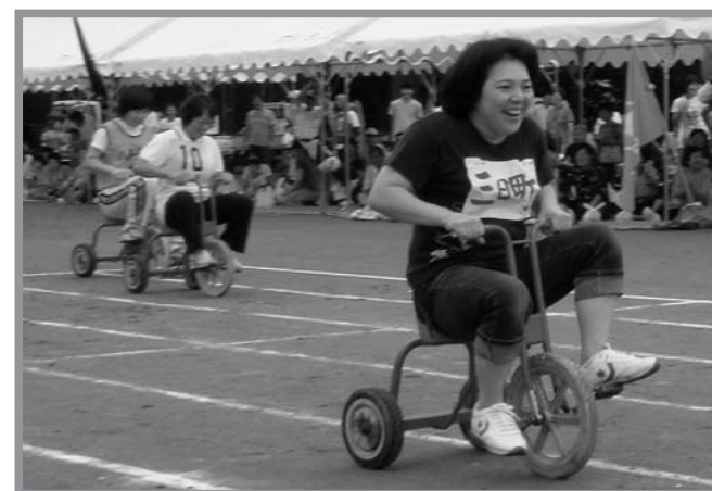
▲バラエティーに富んだ競技を楽しみながらも真剣に競技する参加者

米山各地区のコミュニティ運動会が、9月7日に吉田・西野両地区、9月14日に中津山地区で開催されました。勝ち負けにこだわらず、みんなで楽しめる行事として各地域に定着しているこの行事。バラエティーに富んだプログラムに、応援席のテントでは笑い声あり、手拍子ありで楽しく観戦していました。競技に参加した皆さんは、楽しみながらも真剣そのもの。大勢の皆さんが秋空のもと、気持ちの良い汗を流しました。各地区の優勝行政区は次のとおりです。【吉田】新田【西野】新町【中津山】猪込