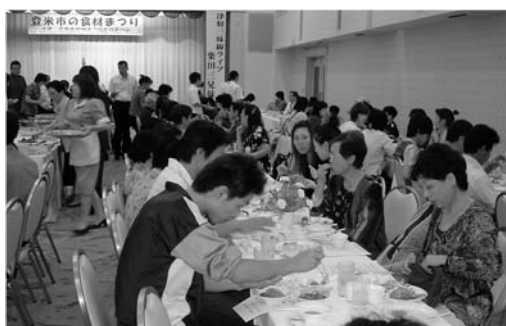
新鮮で豊富な料理が好評の「登米市の食材まつり」

ようと、期間中二度三度と来訪する人もいました。 さらに、市の食材の素晴らしさを地元で味わってもらおうと、9月13日、「登米市の食材まつり」(登米市食材まつり実行委員会主催)が追町のホテルニューグランドヴィアで開催されました。市内外から約200人が参加し、米粉の料理講習を体験したり、地元の農産物を使った料理に舌鼓を打ち、市の豊富な食材を満喫していました。