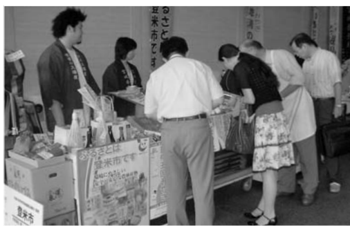
来客でにぎわった県庁玄関ホールでの特産品販売

参加ということもあり、市の知名度はあまり高くなかったものの、牛肉の見事な霜降りとおいしさに、登米産物の評価は上々でした。 また、9月8日から12日まで、県庁の玄関ホールで生産者や小売店など16団体が出展し、登米ブランド認証品や特産品の販売を行いました。約1000人が会場を訪れ、新鮮な野菜や加工品などを買い求めていました。中には、お気に入りの食材を複数購入し