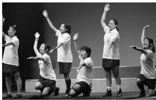
コミカルな演技に会場は笑いに包まれてました

市内の児童、生徒によるミュージカル劇団「ドリーム☆キッズ」の第6回公演「風の声がきこえる2008」が9月13、14日の2日間にわた