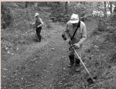
除草作業に汗を流す協議会の皆さん

この環境を維持しようと桜岡地区と善王寺地区の両コミュニティ推進協議会が中心となり、平筒沼ふれあい公園の除草や清掃など、周辺の環境整備を住民が自ら行っています。