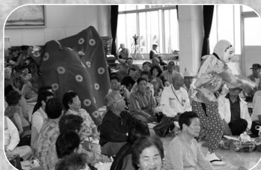
▲見事な演舞を披露した須賀神流芦倉獅子舞（石越）

各地区の祭りや年中行事としてその土地に長く受け継がれ演じられてきた民俗芸能を多くの人に知ってもらおうと「第4回登米市民俗芸能大会」が8月31日、市南方農村環境改善センターで開催されました。会場では神楽や獅子舞、おいとこ踊りなど多くの民俗芸能が保存会によって披露され、会場に訪れた観客を魅了していました。