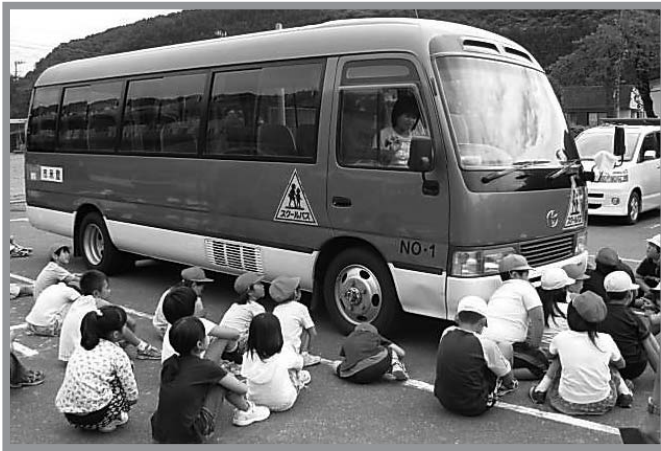
▲児童たちは運転席から見た死角の危険性について学びました