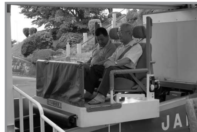
▲体験操作の実践演習コーナーでシートベルトの効果を体験する参加者