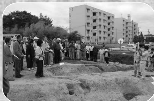
▲館跡を見学しようと多くの皆さんが参加しました

中世や古代の建物跡などの発掘調査が進められている石森館跡で8月23日、発掘の成果を紹介する現地説明会が開催されました。説明会では、県教育委員会の担当者が発掘された平安時代の竪穴住居跡や貞治三（1364）年と明記された石製の供養碑など出土品について説明し、地域住民や関係者など見学に訪れた人は興味深く聞いていました。