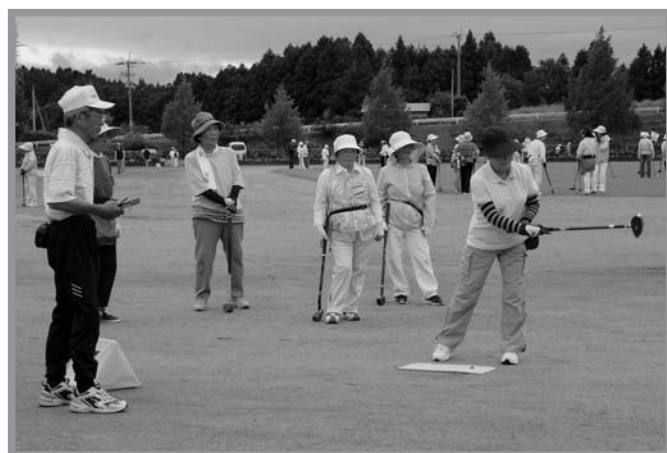
▲市内外から参加した多くの皆さんがプレーを通して交流を深めました

南方農村環境改善センターで8月27日、南方安全安心な地域づくり大会が開催されました。この事業は、交通安全と防犯、双方の視点から「命の大切さ」について一体的な地域づくりを行うため、住民自らが主体となって企画・運営し、総合支所が支援して実現しました。これまで、それぞれの立場で活動してきた交通安全と防犯にかかわる町内各種関係団体が一堂に会し、このような仕組みづくりを構築させたのは新たな試みであり、今後は協働のモデル事例として市内の各方面へと波及効果が期待されます。