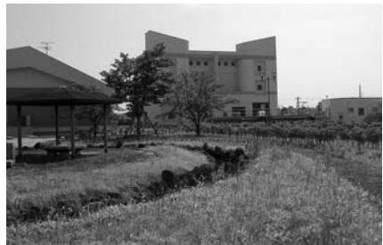
▲佐沼環境浄化センター