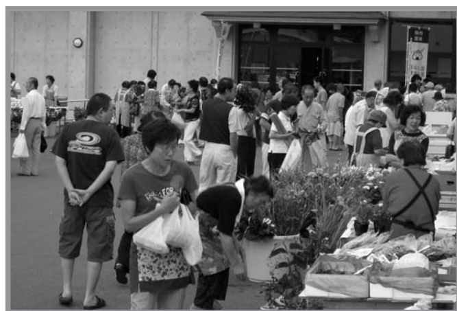
▲早朝から新鮮な地元産の野菜や加工品などを買い求める来場者

石越産の農産物などが取りそろえられた石越ふれあい朝市（主催＝石越町朝市事業推進会議）が石越総合支所駐車場で8月12日に開催され、早朝から大勢の人たちでにぎわいました。当日は、野菜生産者や農産加工研究会らが12店舗を出店。地元で生産された旬の野菜、石越産大豆100%使用の豆腐や油揚げや納豆も販売され、たちまち品切れになりました。また、石越産大豆豆腐が無料でサービスされ、訪れた人は「石越産大豆で作った豆腐と納豆が好きなので毎年楽しみにしています」と話していました。