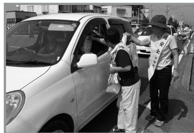
▲30度を越える猛暑の中、ドライバーに交通安全を呼び掛けました