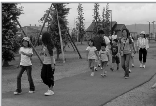
▲早朝のウォーキングで心地よい汗を流す参加者