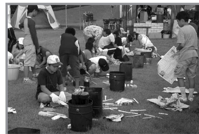
▲煙で涙目になりながらも、お互いに協力してご飯を炊きました

大嶽山交流広場を会場に7月28日から30日までの2泊3日、「大嶽山キャンプ村2008」が開催されました。この事業は、野外活動を通して南方町域内3小学校の6年生の交流を図り、自主性や協調性を養おうと開催され、今年度は60人の児童が参加しました。子どもたちは大嶽山の自然を満喫しながら元気いっぱいに活動し、野外活動を通して互いに交流していました。また、大嶽山興福寺で「命の大切さ」について講話を聞いたり、子ども達が自分たちで縫ったぞうきんを使ってお堂を掃除したりしました。