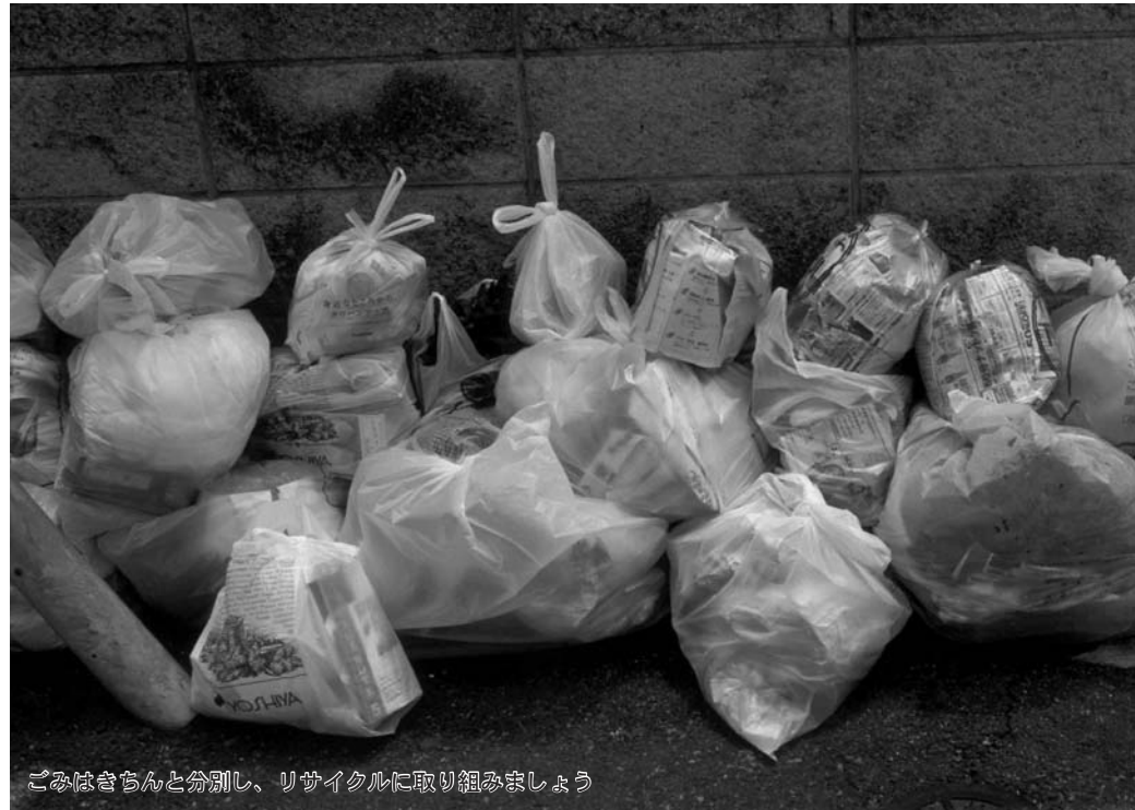
ごみはきちんと分別し、リサイクルに取り組みましょう