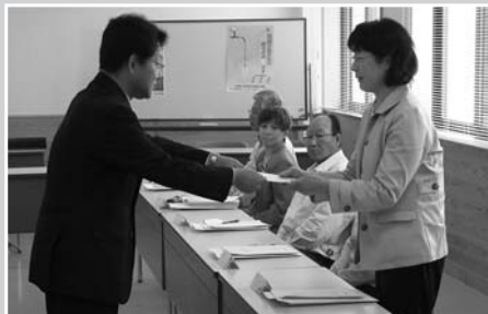
布施市長からモニターの皆さんに委嘱状が交付されました