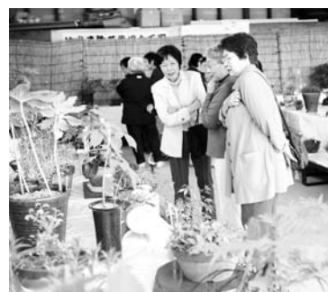
今年で11回目を数える展示会（迫）