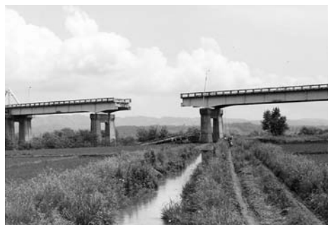
宮城県沖地震により崩落した錦桜橋（中田）

るのが宮城県沖地震で、想定される地震の規模はマグニチュード7・5前後。また、陸地から離れた日本海溝寄りの海域で発生する地震も想定され、宮城県沖地震がこの海溝寄りでは発生する地震と連動すれば、マグニチュード8・0前後の巨大地震が起こり大きな被害が発生すると予想されています。 再来が予想される宮城県沖地震について、単独型・連動型などタイプ別に県がまとめた「第3次地震被害想定調査」結果によると、単独型・連動型ともに県内のほとんどの地域で震度6弱以上の揺れになると予測。冬期間の午後6時に発生した場合の死者は、単独型で96人、連動型で164人と算出し、死者28人だった昭和53年の地震よりも、はるかに大きな被害を予想しています。