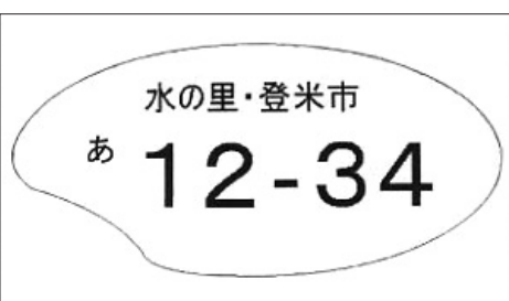
▲投票の結果ご当地ナンバーはコメ型に