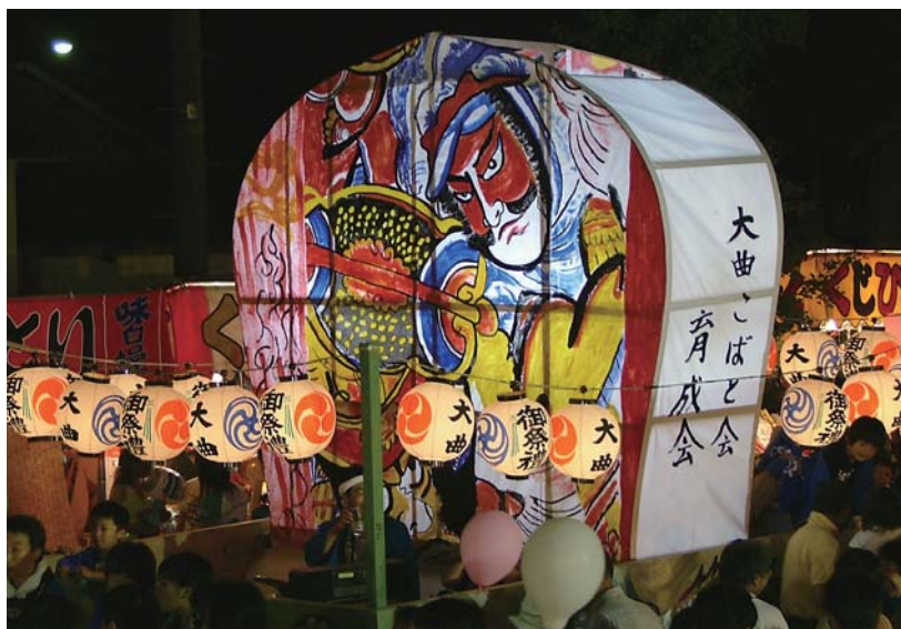
【問い合わせ】YOSAKOI & ねぶた in とよさと実行委員会 (豊里総合支所地域生活課内) ☎ 0225 (76) 4111