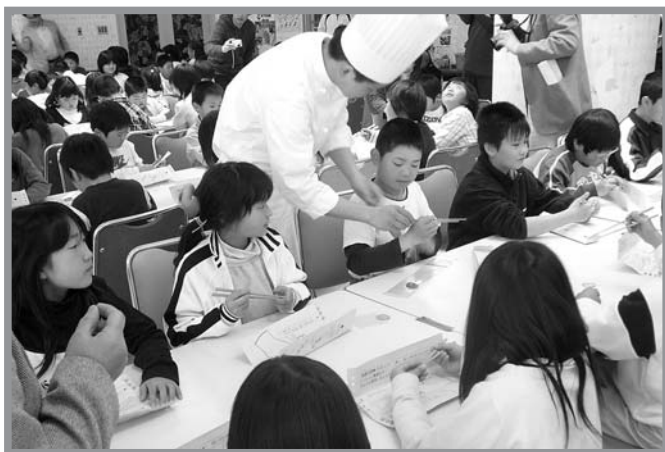
▲明成高校調理科の生徒に正しいはしの使い方を学ぶ横山小児童