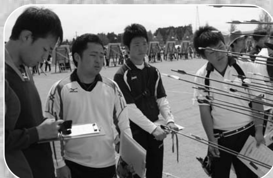
▲色ごとに分けられた矢で得点を確認し合う選手たち

第9回みやぎ弓の里A1カップが5月4日、東和総合運動公園で開催され、東北地方や関東地方各県から一般・少年男女ら約172人が出場し、日ごろ鍛えた技を競い合いました。参加した選手は4種目ごとに分かれ、風や角度などを計算しながら30mから90m先の直径80cmのわずかな的をめがけ矢を放っていました。