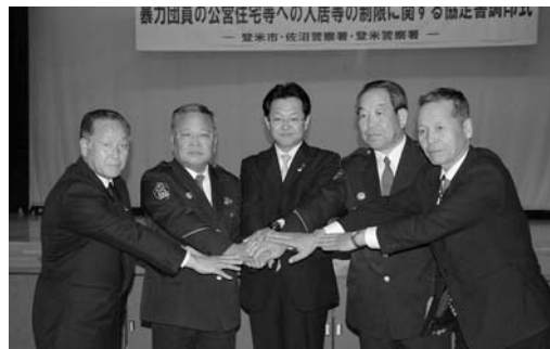
安心して生活できる環境を目指し協力を誓いました

市と佐沼・登米両警察署は4月28日、中田農村環境改善センターにおいて、行政・警察相互間の連携を強化し、公営住宅から暴力団員を排除することを取り決めた、協定書の調印式を行いました。