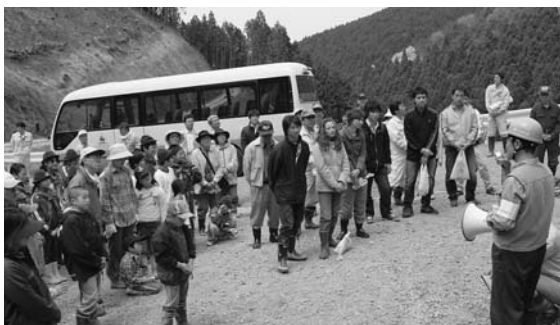
杉の成長過程の説明を受ける参加者