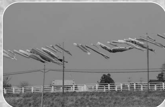
▲気持ちよく泳ぐこいのぼりの姿が見られました

4月12日から5月10日まで、浅水コミュニティ運営協議会の主催により、中田町浅水地区のサイクリングロードへのアクセス道路約200mに、大小さまざまなこいのぼり約150匹が揚げられ、心地よい風に揺られて泳いでいました。この事業は子どもたちが元気に成長することを願い、平成6年から毎年続けられており、今年で15年目となっています。