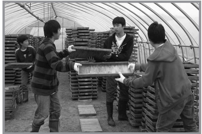
▲慣れない手つきながらも協力して育苗の苗箱を重ねる生徒たち

農作業を通して農村部の生活を体験しようと、東京都世田谷区立松沢中学校3年生148人が5月14日から2泊3日、市内の農家に民泊しました。東和町では16世帯が63人の生徒を受け入れ、各農家ごとに水田作業や畑作業などを行いました。体験では、3～5人のグループに分かれ、田植えや野菜の収穫などを体験しました。初めて農作業を体験した生徒は「緑が多くてご飯がとてもおいしい。農作業など経験したことが無い、貴重な体験ができて良かった」と話してくれました。