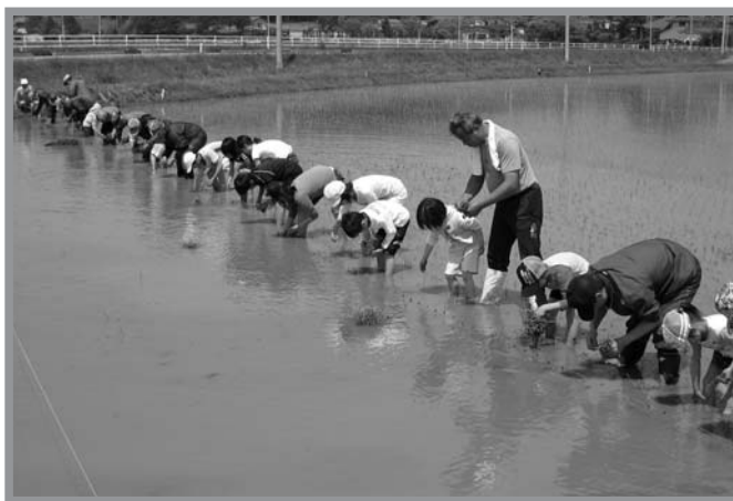
▲手作業での田植えにとまどいながらも丁寧に植えていました

食糧不足に悩んでいるアフリカのマリに支援米を送ろうと5月18日、遠沢地区子ども会・育成会などから約40人が参加し、昔ながらの手作業で田植えが行われました。当日は、開会式の後、遠沢地区内のアフリカ支援米学習田8㍓に移動、作業が始まると参加者は横一列に並び、手際よく田植えを行いました。参加した子どもたちは、慣れないぬかるみに足を取られ四苦八苦しながらも、心を込めて苗を一株ずつ丁寧に植えていました。今回植えられた支援米は秋の収穫を待ってアフリカに送られます。