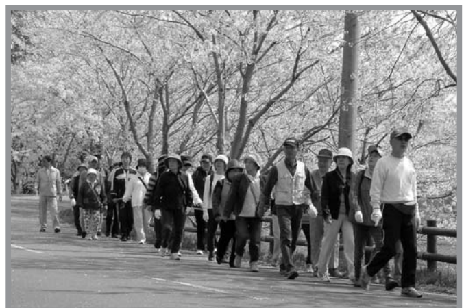
▲千本桜のみごとな景色を眺めながらウォーキングを楽しむ参加者

歩くことを通じて健康増進とリフレッシュを目的に、スプリングハイク（迫公民館・迫勤労青少年ホーム主催）が4月22日開催され、30代から70代までの市民の皆さんが参加しました。昨年までは迫地区内のコースでしたが、今年は南方地区にコースを設定。砥落橋付近をスタートし、千本桜並木などを通るおよそ7kmのコースを1時間半かけて歩き、ゴールの牛トピアに到着しました。参加者は、「桜が満開で素晴らしかった」「来年もほかの地区のコースを歩いてみたい」と話していました。