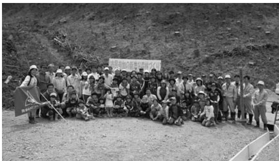
植樹に参加したボランティアの皆さん