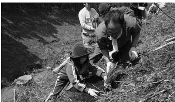
指導を受けながら植樹する児童

植樹終了後には、市から「もくもくハウス」で製作したストラップが参加者にプレゼントされました。