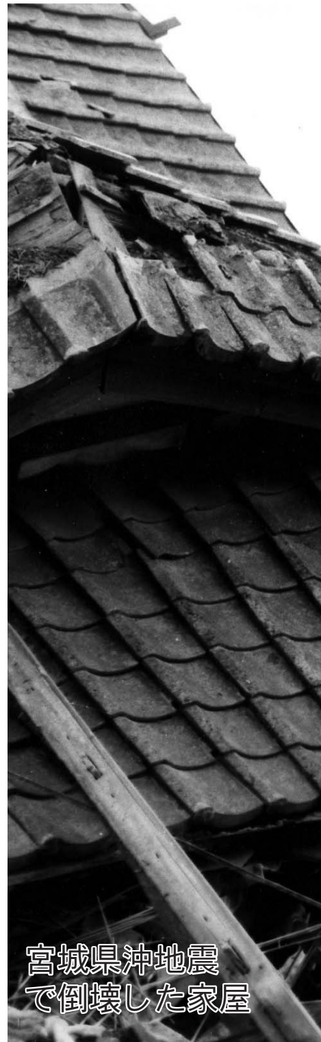
宮城県沖地震で倒壊した家屋

るのが宮城県沖地震で、想定される地震の規模はマグニチュード7・5前後。また、陸地から離れた日本海溝寄りの海域で発生する地震も想定され、宮城県沖地震がこの海溝寄りでは発生する地震と連動すれば、マグニチュード8・0前後の巨大地震が起こり大きな被害が発生すると予想されています。 再来が予想される宮城県沖地震について、単独型・連動型などタイプ別に県がまとめた「第3次地震被害想定調査」結果によると、単独型・連動型ともに県内のほとんどの地域で震度6弱以上の揺れになると予測。冬期間の午後6時に発生した場合の死者は、単独型で96人、連動型で164人と算出し、死者28人だった昭和53年の地震よりも、はるかに大きな被害を予想しています。