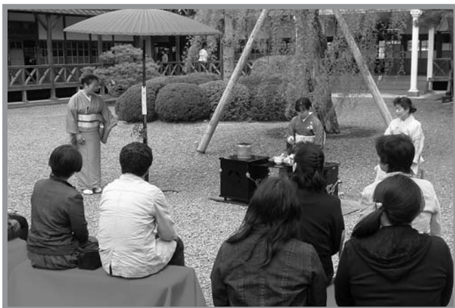
▲各会場では見事なお点前が披露され大勢の人が堪能していました