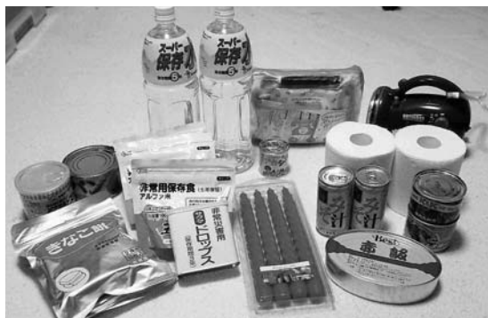
いざというときのために備えておきましょう