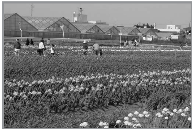
▲見事に咲いたチューリップを見ようと大勢の人が訪れました