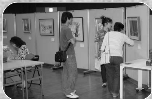
▲市民の力作62作品と特別展示11作品が展示された登展

第4回登米市民ふれあい美術展「登展」（登展実行委員会、(財)登米文化振興財団主催）が4月30日から5月5日まで、登米祝祭劇場で開催されました。美術展には、幅広い年齢層の市民の皆さん42人が、水墨・水彩・油彩画などの力作62作品を出展。そのほか、ポスターの原画、各種展示会の入賞作品などの特別展示もあり、大勢の人が訪れていました。