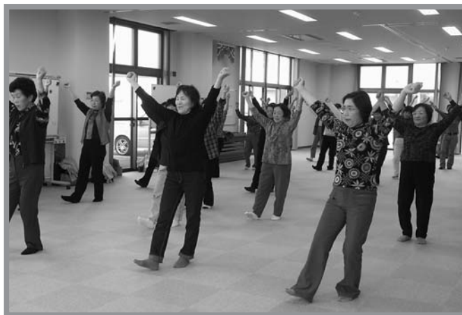
▲楽しく「はやね はやおき あさごはん」ダンスに取り組む参加者

市食生活改善推進協議会中田分会総会が4月25日、中田保健福祉会館で開催され会員42人が参加しました。同会は、食生活改善を通して健康増進を進めることを目的に設置され、親子食育教室や生活習慣病を予防する食事の講習会などを行っています。総会終了後には、食生活を改善するための研修会と「はやね はやおき あさごはん」の食育ダンスを実施し、リズムに合わせながら体を動かしました。会員は「多くの子どもたちに、はやね はやおき あさごはん運動をもっと普及させたい」と話していました。