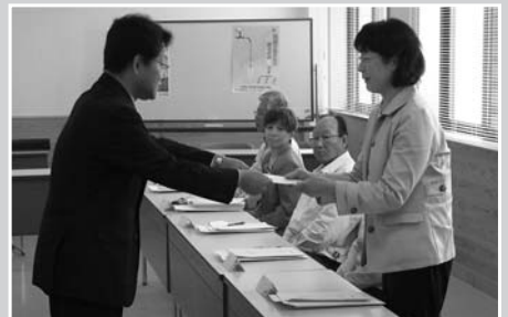
布施市長からモニターの皆さんに委嘱状が交付されました