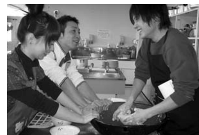
◀昨年の学習会の様子

※ファクシミリと電子メールの場合は、住所・氏名・年齢・電話番号を記入の上、ヤングセミナー受講希望と明記してください。