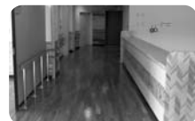
◀ 地域産材を使用した新津山総合支所