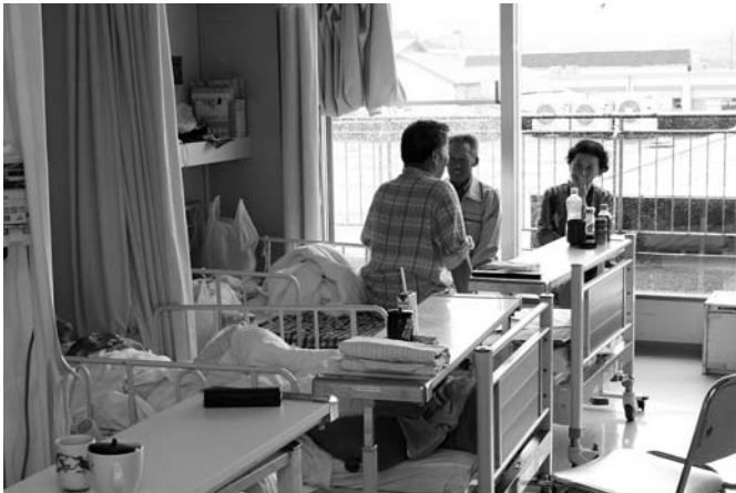
市民皆さんに「安全・安心」の医療が提供できるように、医師確保・経営改革を含めた医療体制の整備を進めていきます