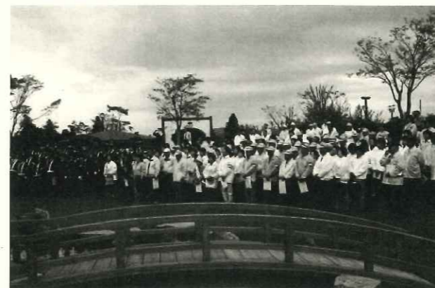
春の交通安全運動市民大会を開催します

○とき 4月7日(月) 午前11時15分～ ○ところ 登米総合体育館(とよ蔵ジヤム)前広場