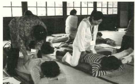
昨年行われたセミナーの様子