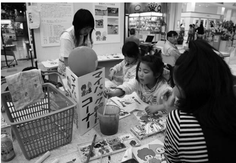
環境キャラクター「トメル君とオトメちゃん」入りマイバッグに絵付けする親子

第1回市環境まつりが3月15、16の両日、ロックシティ佐沼で開催されました。会場は多くの買物客が往来する中央玄関のセントラルコート。1日目は宮城県森林インストラクター協会会員に