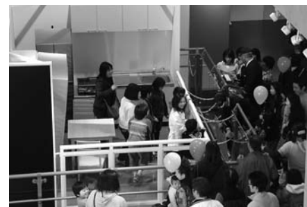
3月22・23日の庁舎見学会には、約1,500人が来場しました。

1階は地震体験、消火体験、防災用品の展示、2階には煙(避難)体験や緊急通報体験などができる「防災体験・展示ホール」を整備しています。万が一のときに備え、防災意識、防災対応力を身に付けることができます。