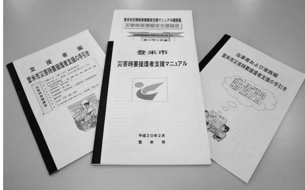
3月に策定した「災害時要援護者支援マニュアル」に基づき、災害時に支援が必要な人の手助けをします