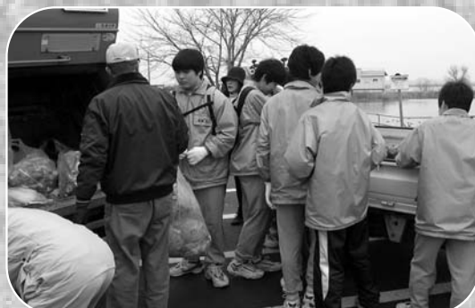
▲回収したごみを分別して集積車に積み込む参加者

ラムサール条約指定地の伊豆沼・内沼の自然環境を保全するために、「第44回伊豆沼・内沼クリーンキャンペーン」が3月20日、市サンクチュアリセンターで行われました。地区内の小中学生や市内の企業、各種団体から約520人が参加。およそ2時間にわたり、沼周辺に捨てられていた空き缶・瓶や雑誌、たばこの吸殻などの回収に汗を流しました。