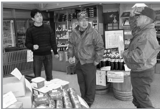
▲団員らが各家庭を訪問して住宅火災警報器の設置を呼び掛けました

春の全国火災予防運動の一環として、一般家庭防火査察が3月9日に登米町内で実施され、市消防団登米支団員らが参加しました。例年春には、独居老人宅のみを訪問していますが、今回は地域で連続して火災が発生したことや今年5月から設置が義務付けられる住宅用火災警報器設置の呼び掛けを行うために、地域全世帯へと範囲を拡大して実施しました。特に警報器については、5月31日までに設置することが義務付けられているため、参加した団員は積極的な設置を呼び掛けていました。