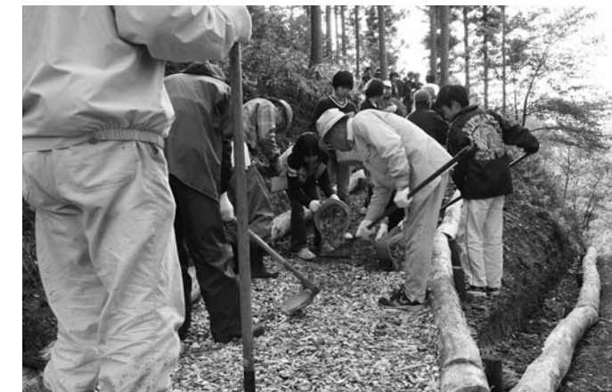
市民皆さんが市政に参加しやすい環境を整備を推進するため、「(仮称)登米市協働のまちづくり推進条例」の制定に向けて検討・準備します

「協働のまちづくり」 市民皆さんが市政に参加しやすい環境を整備を推進するため、「(仮称)登米市協働のまちづくり推進条例」の制定に向けて検討・準備します。 「(仮称)登米市協働のまちづくり」の制定に必要な検討・準備を進めます。 また、市民皆さんが相互の結びつきを深めながら、地域の課題解決に向けた行動計画などをまとめた、地域の将来ビジョンとなる「市民が創る地域のまちづくり計画」の策定に向けて取り組みます。 次に、地域自治組織や市民活動団体などが安心して地域づくりや市民活動に参加できるように、活動中の負傷、損害賠償などさまざまな事故への補償制度として、新たに「市民活動総合補償制度(5頁参照)」を確立していきます。