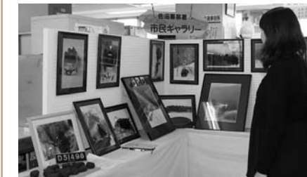
▲3月はS L列車写真が展示されました