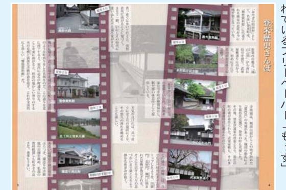
登米町の魅力が盛りだくさんに掲載されているフリーペーパー「もっす」