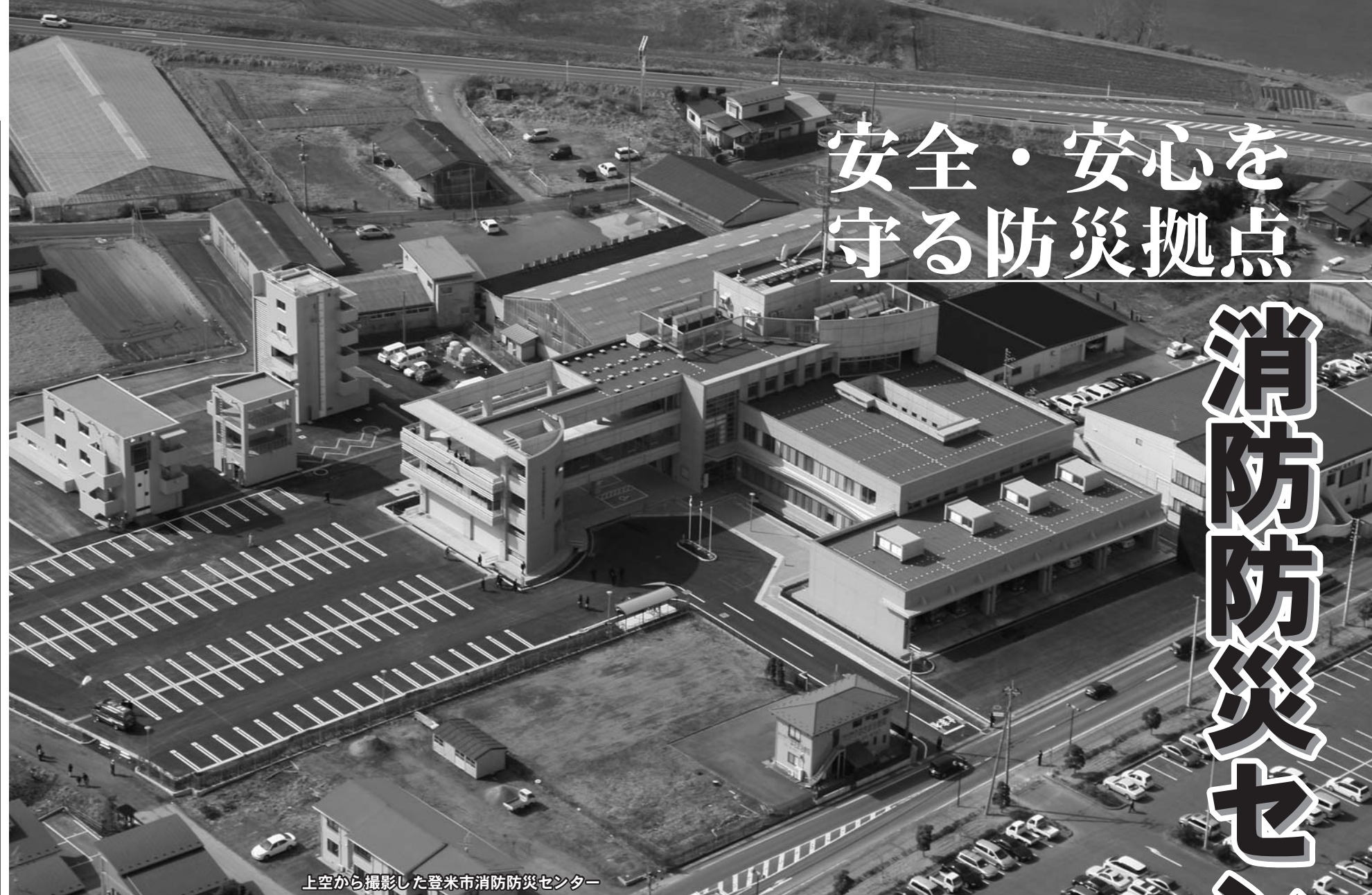
上空から撮影した登米市消防防災センター