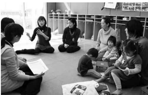
子どもの生活の様子や妊娠期の悩みを話す母親

から表彰状が贈られました。2日間を通して実施された環境キャラクター「トメル君とオトメちゃん」入りマイバッグの絵付け体験では、参加者が思い思いに色を塗ってオリジナルのバッグを製作。ぬり絵大会や描き方教室も行われたほか、環境パネル展、エコ検定のPR活動などたくさん市のイベントもあり、多くの市民が環境に理解を深めた2日間となりました。