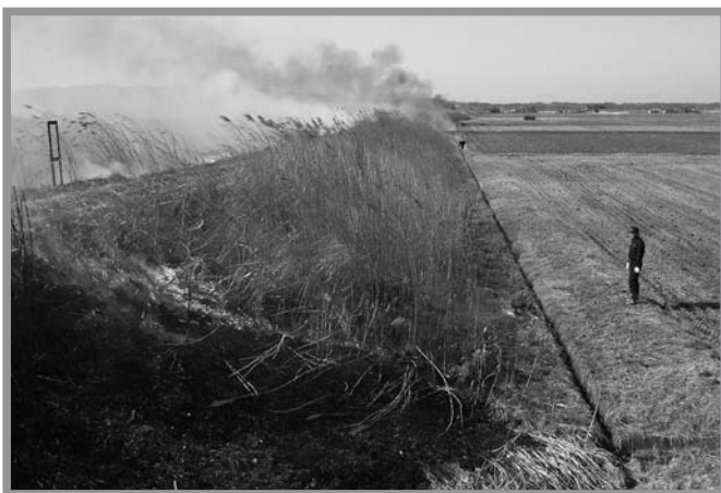
▲不審火予防のため河川敷の枯れ草やごみなどを燃やす団員