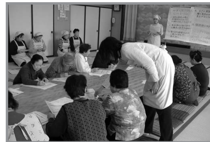
▲減塩をテーマに体に良い調理方法などを学ぶ参加者

食生活改善講習会（ヘルスサポーター21事業）が3月5日、津山ふれあいセンターで開催され、食生活改善推進員、地区住民35人が参加しました。この講習会は、食を通して楽しく健康づくりを実践してもらおうと、推進員（食生活の改善に取り組むボランティア）が企画したものです。参加者は肥満が引き起こす、さまざまな病気について学んだ後、減塩をテーマに調理実習を行いました。また、講習会終了後には、受講者へ「ヘルスサポーター登録証」が交付されました。