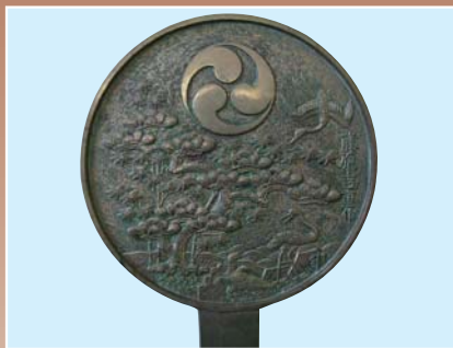
巴紋は和鏡などにもみられます

武器だけではなく家紋、衣類などさまざまなシーンで見られる巴紋は、日本だけではなくアジアに広く見られる文様の一つです。形が弓を射るとき、手首に巻いた鞆という道具に似ていたため、「鞆の絵」が転じて「ともえ」紋と称したといわれています。紋のルーツのほか、遺跡から出土する勾玉に似ているといわれ、蛇のとぐろ、雷光なども考えられているようです。また、水の渦巻く形ともいわれ、瓦に見られる巴紋は防火の意味が込められています。