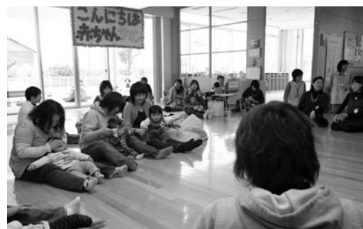
参加した親子全員で手遊びをしました

院で出産することができず、皆さんにご迷惑をお掛けしています。妊娠期間中は、多くの悩みや不安なことがあるので、同じ立場の人たちで話をしたり、触れ合ったりして悩みを解消してください」とあいさつしました。参加者は、3つのグループに分かれてフリートークキングを実施。「体重管理が難しい」「夜泣きをして大変」「第1子の面倒を見ながら、生まれてくる子どもにも母乳を与える良い方法は」など、悩み事や心配事などが話し合われました。その後、同センターの職員による手遊びや、助産師、栄養士、歯科衛生士、保健師の専門スタッフによる相談受付もありました。