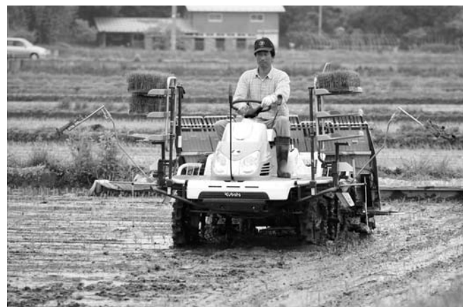
「農地・水・環境保全向上対策」を引き続き推進し、力強い農業構造の確立と先進的な営農活動を支援していきます

これを受けて市として検討を重ねた結果、現在の医療水準を最大限確保しながら、「安全・安心の医療提供」「医師の労働環境の改善」「安定した経営基盤の確立」を目指し、断腸の思いで市立病院の再編・改革の基本方針を決定しました。