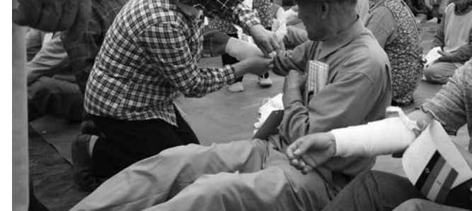
災害時における「共助」の中核となる自主防災組織の結成と育成を推進し、地域防災力の向上に貢献できる組織体制づくりを目指します

推進します。 また、縮まるどころかささらに拡大した経済の地域格差の中で、本市の産業振興の構造を改革するため、19年度に策定した「登米市産業振興総合計画（経済成長戦略）」の計画的、かつ積極的な取り組みにより、地域経済戦略の拡充と雇用機会の向上を見据えた地域循環型産業の構築を目指した事業に取り組みます。 次に、新たな企業支援と雇用創設を拡大するため、センทรัล自動車宮城県進出に伴う、自動車関連産業の幅広い分野の企業集積に対応する誘致活動を、関係機関と密接な連携の下、鋭意努力します。 また、産業界、大学、行政の産学官連携により研究・開発された高度な技術の情報収集に努め、その情報を既存企業に提供することで、技術力の高度化を支援します。こうした取り組みの実効性を確保するため、引き続き企業誘致と雇用創出に向け、