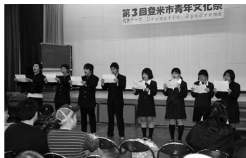
豊里町青年会が合唱を披露

院で出産することができず、皆さんにご迷惑をお掛けしています。妊娠期間中は、多くの悩みや不安なことがあるので、同じ立場の人たちで話をしたり、触れ合ったりして悩みを解消してください」とあいさつしました。参加者は、3つのグループに分かれてフリートークキングを実施。「体重管理が難しい」「夜泣きをして大変」「第1子の面倒を見ながら、生まれてくる子どもにも母乳を与える良い方法は」など、悩み事や心配事などが話し合われました。その後、同センターの職員による手遊びや、助産師、栄養士、歯科衛生士、保健師の専門スタッフによる相談受付もありました。