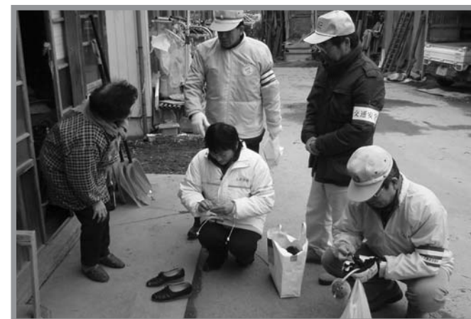
▲会員が高齢者のいる世帯を訪問し靴に反射材を貼りました

年々増加している高齢者の交通事故を防止しようと、交通安全啓発高齢者戸別訪問が2月24日、中田町上沼籠壇区内で実施されました。佐沼地区交通安全協会上沼支部・交通安全母の会の会員12人が、2班に分かれて70歳以上の高齢者がいる45世帯を訪問。交通安全啓発チラシの配布や、夜間の外出時の事故防止用にと、車のヘッドライトで反射する靴用の反射材を対象者の靴に貼って交通事故防止を呼び掛けました。訪問されたお年寄りも、「今後夜間に出掛けるときは、この靴を履いて出掛けます」と話していました。