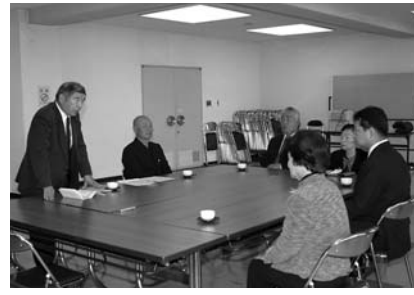
毎回、活発な意見交換が行われています(米山)

【申し込み・問い合わせ】 〒987-1051 登米市迫町佐沼字中江二丁目6番地1 総務部市長公室 広報広聴係 ☎0220(22)2090 FAX0220(22)9164 ✉koho@city.tomeniyagi.jp