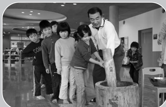
▲放課後児童クラブの子どもたちがもちつきに挑戦

もちつき、鏡もちづくりが12月25日、南方子育てサポートセンターで行われ、放課後児童クラブ（小学1～3年生）の児童17人が参加しました。子どもたちは、昔ながらのきねと臼を使ったもちつきを体験。職員の指導で力強くつきあげました。その後、鏡もちづくりにも挑戦し、思い思いにかわいらしいミニ鏡もちを完成させました。