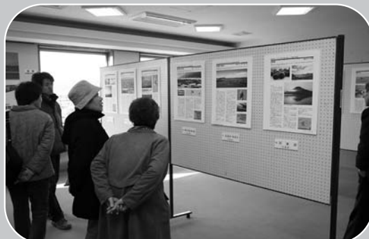
▲興味深い目で登録湿地のパネルを見学する来場者

特別企画ラムサール条約登録湿地パネル展が、11月1日から1月31日まで市伊豆沼・内沼サンクチュアリセンターで行われました。施設内には、伊豆沼・内沼をはじめとした、日本の登録湿地33カ所を紹介するパネルを展示。チラシやポスターなども併せて紹介されました。冬休み期間中には、連日多くの親子連れが訪れ、にぎわいをみせていました。