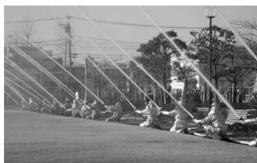
ポンプ車18台による一斉放水も行われました

その後、退職や永年勤続などの団員や防火水槽用地の協力者へ感謝状の贈呈がありました。