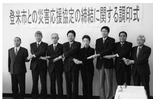
固いスクラムを組んで連携強化を誓った出席者