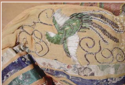
収蔵展「文様の世界～生活の中の美～」は2月9日から5月11日まで開催しています

伝統的な文様には、もともと意味があるといわれていますが、歴史博物館所蔵の雛人形に見られる文様にも意味があります。写真は女雛の衣装に施された鳳凰の文様です。中国では皇帝の象徴が龍であるのに対し、鳳凰は皇后の象徴とされました。鳳凰は鳳がオスで凰がメスの鳥。名君が現れたときに姿を現し、「相飛び相鳴けば天下泰平の世が訪れる」といわれたことから、皇后の象徴となったと伝えられています。このような意味がある鳳凰の刺しゅうは、武家の雛人形にふさわしい文様といえます。