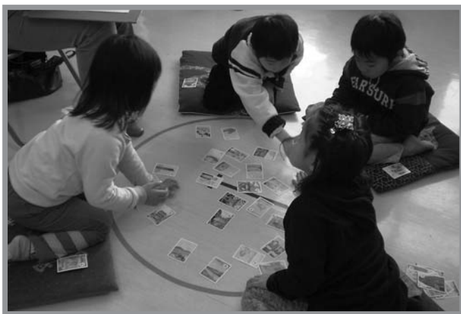
▲歴史や史跡名勝などが描かれたかるたで勉強しながら競いました