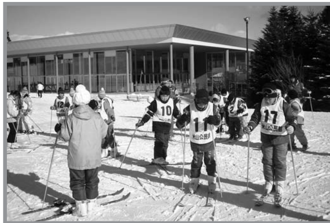
▲雪の感触を楽しみながらスキーの指導を受ける参加者

米山町内の小学生を対象とした、かかしっこクラブ「スキー教室」が1月19日、大崎市鳴子「リゾートパークオニコウベスキー場」で行われ、児童20人が参加しました。けが予防のため、念入りに準備体操を行った後、レベルに合わせた班に分かれて指導員から指導を受けました。午後からは、ジュニア・リーダーと交流しながら、一緒にリフトで山頂付近まで上り、白銀のゲレンデにシュプールを描きました。参加者のほとんどが初心者でしたが、終盤にはスキーにも慣れ、歓声を上げながら雪の感触を楽しみました。