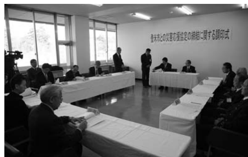
調印した協定書を取り交わしました

大規模災害時における減災や応急対応などのために、応援協定の調印式が12月18日、市役所庁舎で行われました。市と協定を締結したのは、東北電力(株)栗原登米営業所、宮城県レッカー事業協同組合、