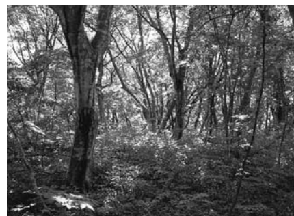
純林としては県内唯一のアカシデ自然林

今回明らかになった調査結果は、貴重な自然や絶滅のおそれがある動植物種の保全策を講じるための基礎資料として活用されるほか、開発行為の審査や環境教育・環境学習の基礎資料など、さまざまな活用法が期待されています。報告書は市民生活部環境課と各総合支所地域生活課で閲覧できるほか、市内の図書館、宮城県図書館、国立国会図書館などでどなたでも閲覧することができます。また、報告書本文の大部分は市のホームページで見ることがもできます。市では今後、調査結果を分かりやすくまとめて、市民皆さんに紹介していく予定としていますので、ぜひこうした資料を活用して市内の豊かな自然について理解を深めましょう。