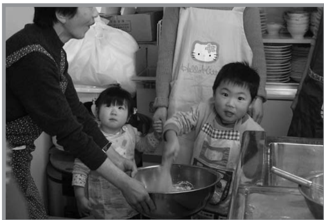
▲親子がチーズ入りドーナツ作りに挑戦した「親子クッキング」