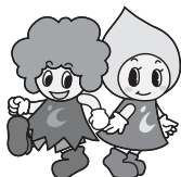
トメル君 オトメちゃん