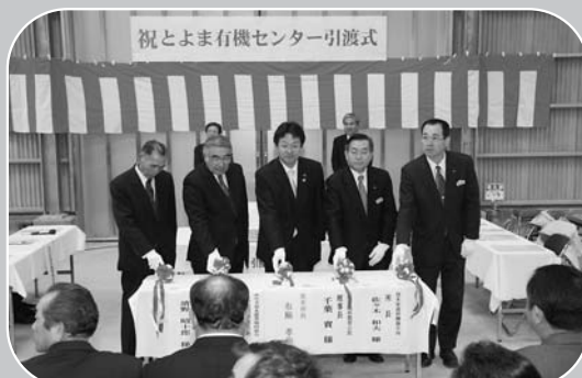
▲スイッチを押して攪拌機を始動させる関係者

とよま有機センターの完成に伴い、引渡式が12月28日、同センター内で行われ、県農業公社や市、JAみやぎ登米の関係者ら約50人が出席しました。施設は9,345平方 か メートルの敷地に、発酵棟や保管棟などが建てられ、オープン式攪拌機設備、脱臭・袋詰設備などが整備されています。年間の稼働日数は300日で、堆肥生産量は4,770 ト です。