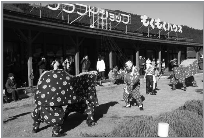
▲道の駅「もくもくランド」で華麗な舞を披露した火伏せの獅子舞