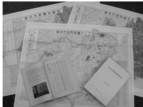
出来上がった自然環境基礎調査報告書

調査は平成18年10月から19年10月まで、(株)宮城環境保全研究所に委託し、「気象」「地形・地質および土壌」「植物」「動物」の各項目について行われました。調査員は約1年間、人跡まれな所にまで分け入りながら、自然環境の実態をくまなく調査しました。