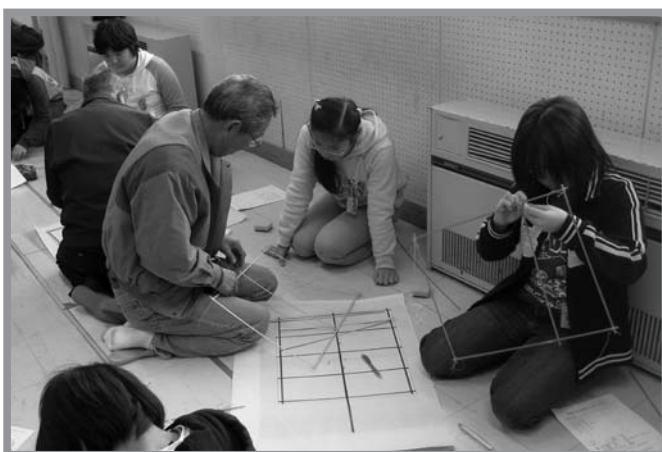
▲講師の指導で「とよま凧（角凧）」を作製する登米小の児童

地域に古くから伝わる「とよま凧（角凧）」の作製を通じて、伝統文化を学びながら創作することの喜びや昔の遊びに親しんでもらおうと、「ふるさと学習会」が1月16日、登米小で行われました。小学6年生40人が参加。普段、屋内でテレビゲームなどで遊ぶことが多い児童たちは、触れたり遊んだりすることが少なくなったたこ作りを、講師から指導を受けながら熱心に取り組みました。次回の学習会には、糸付けなどの作業を行い、完成したたこで実際にたこ揚げをすることになっています。