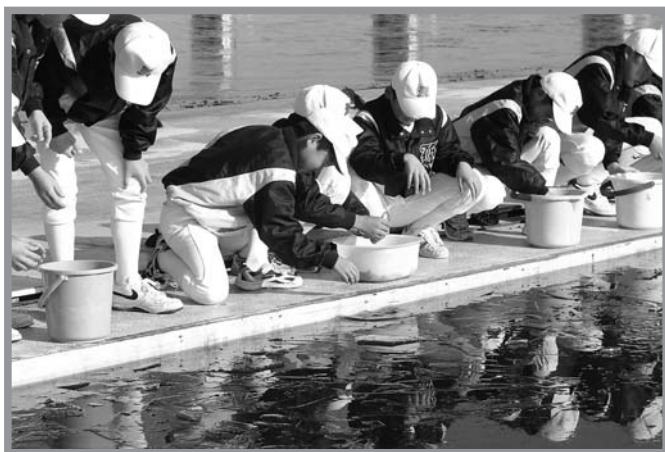
▲薄い氷が張った沼にコイとヘラブナの稚魚を放流する団員