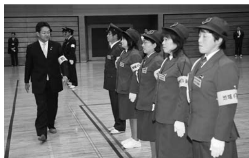
防犯指導隊員一人一人の服装を点検する市長

また、防犯指導隊と交通安全指導隊の出初め式が1月5日、中田総合体育館でそれぞれ午前と午後で開催され、市内各地区の防犯指導隊員82人、交通安全指導隊員105人が参加しました。式では、隊員全員が大きな声で点呼。規律正しい服装点検が行われ、市長告辞、隊長訓示などがありました。