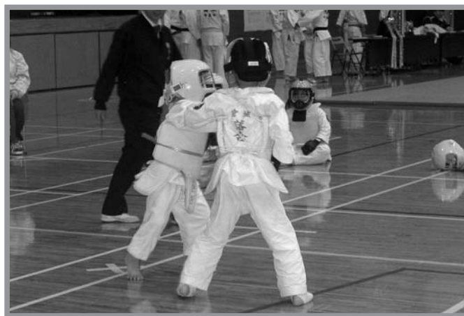
▲空手や剣道、柔道の武道の祭典で熱戦が繰り広げられました

第28回中田町武道祭（市、県公立武道館協議会主催）が1月19日、中田総合体育館で開催されました。この武道祭は、武道愛好者が一堂に会し、日ごろの修練の成果を披露することや、体力、スポーツ技術の向上と参加者の融和を目的に開催されています。競技前には、空手や戸山流居合などの「形」が披露され、参加者はその見事な演舞を真剣な眼差しで見入っていました。その後、空手、剣道、柔道の各競技が行われ、それぞれの種目に小中学生71人が参加し、熱戦を繰り広げました。