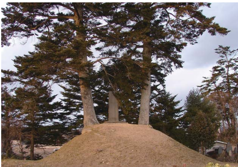
【所在地】登米市迫町北方字山ノ上9番地2 【問い合わせ】登米市教育委員会生涯学習課 ☎ 0220 (34) 2698