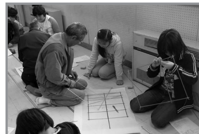
▲講師の指導で「とよま凧（角凧）」を作製する登米小の児童

地域に古くから伝わる「とよま凧（角凧）」の作製を通じて、伝統文化を学びながら創作することの喜びや昔の遊びに親んでもらおうと、「ふるさと学習会」が1月16日、登米小で行われました。小学6年生40人が参加。普段、屋内でテレビゲームなどで遊ぶことが多い児童たちは、触れたり遊んだりすることが少なくなったたこ作りを、講師から指導を受けながら熱心に取り組みました。次回の学習会には、糸付けなどの作業を行い、完成したたこで実際にたこ揚げをすることになっています。