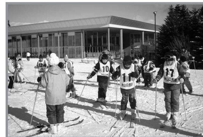
▲雪の感触を楽しみながらスキーの指導を受ける参加者

米山町内の小学生を対象とした、かかしっこクラブ「スキー教室」が1月19日、大崎市鳴子「リゾートパークオニコウベスキー場」で行われ、児童20人が参加しました。けが予防のため、念入りに準備体操を行った後、レベルに合わせた班に分かれて指導員から指導を受けました。午後からは、ジュニア・リーダーと交流しながら、一緒にリフトで山頂付近まで上り、白銀のゲレンデにシュプールを描きました。参加者のほとんどが初心者でしたが、終盤にはスキーにも慣れ、歓声を上げながら雪の感触を楽しみました。