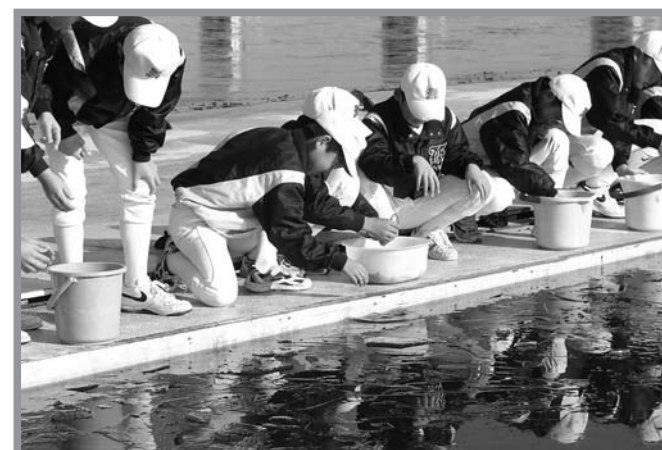
▲薄い氷が張った沼にコイとヘラブナの稚魚を放流する団員