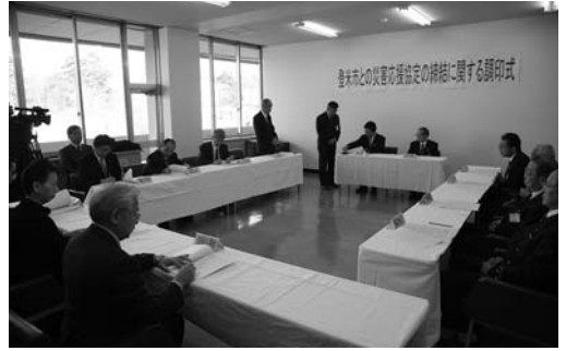
調印した協定書を取り交わしました

大規模災害時における減災や応急対応などのために、応援協定の調印式が12月18日、市役所庁舎で行われました。市と協定を締結したのは、東北電力㈱栗原登米営業所、宮城県レッカー事業協同組合、