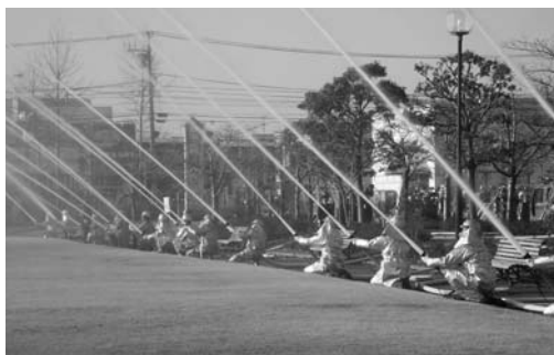
ポンプ車18台による一斉放水も行われました

力者へ感謝状の贈呈がありました。また、防犯指導隊と交通安全指導隊の出初め式が1月5日、中江総合体育館でそれぞれ午前と午後に開催され、市内各地区の防犯指導隊員82人、交通安全指導隊員105人が参加しました。