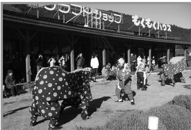
▲道の駅「もくもくランド」で華麗な舞を披露した火伏せの獅子舞