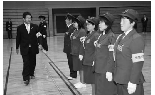
防犯指導隊員一人一人の服装を点検する市長

市長は「昨年の9月は台風9号の影響で、北上川が特別警戒水位に達し、付近住民に避難勧告を発令しましたが、消防団関係者の皆さんの力で被害を最小限にとどめることができました。今後も災害から市民の生命、身体、財産を守るために、防災活動に励んでください」とあいさつしました。