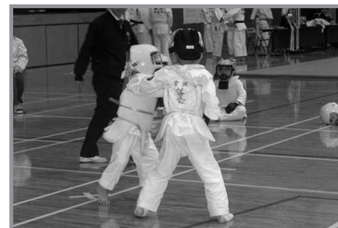
▲空手や剣道、柔道の武道の祭典で熱戦が繰り広げられました

第28回中田町武道祭（市、県公立武道館協議会主催）が1月19日、中田総合体育館で開催されました。この武道祭は、武道愛好者が一堂に会し、日ごろの修練の成果を披露することや、体力、スポーツ技術の向上と参加者の融和を目的に開催されています。競技前には、空手や戸山流居合などの「形」が披露され、参加者はその見事な演舞を真剣な眼差しで見入っていました。その後、空手、剣道、柔道の各競技が行われ、それぞれの種目に小中学生71人が参加し、熱戦を繰り広げました。