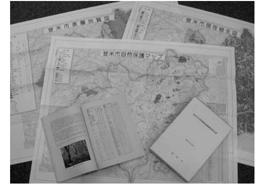
出来上がった自然環境基礎調査報告書