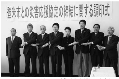
固いスクラムを組んで連携強化を誓った出席者

(株)登米市医師会と、弊特会、元気村、掬水会、清山会の4つの社会福祉法人。それぞれ電力設備の応急復旧措置、車両の撤去、要援護者の避難場所提供、救護活動の支援を行うという内容です。