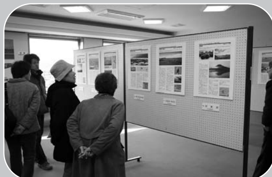
▲興味深い目で登録湿地のパネルを見学する来場者

特別企画ラムサール条約登録湿地パネル展が、11月1日から1月31日まで市伊豆沼・内沼サンクチュアリセンターで行われました。施設内には、伊豆沼・内沼をはじめとした、日本の登録湿地33カ所を紹介するパネルを展示。チラシやポスターなども併せて紹介されました。冬休み期間中には、連日多くの親子連れが訪れ、にぎわいをみせていました。