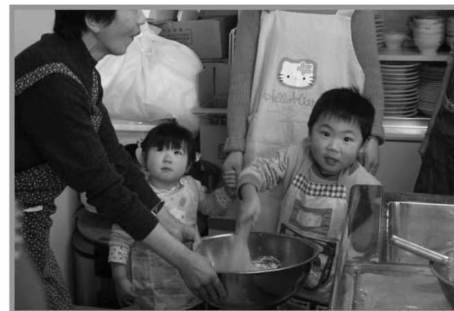
▲親子がチーズ入りドーナツ作りに挑戦した「親子クッキング」

親子で料理を楽しみながら食育を学ぼうと、「親子クッキング～簡単おやつ～」が1月22日、東和地域福祉センターで行われました。参加したのは、子育て支援センター「わいわい広場」で活動している18組の親子。今回はサツマイモを使った、チーズ入りドーナツ作りに挑戦しました。かわいいエプロン姿の子どもたちは、お母さんの手を借りながら生地を練ったり、小さな手で丸めて形を作ったりして調理。出来上がったドーナツを食べて「とてもおいしい」などと、みんなで作った味に満足の様子でした。