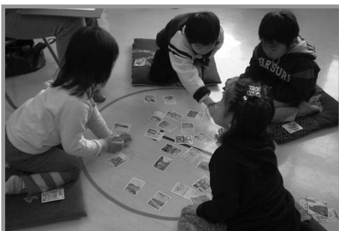
▲歴史や史跡名勝などが描かれたかるたで勉強しながら競いました

コイとヘラブナの稚魚の放流が1月14日、長沼で行われ、長沼漁協の組合員と野球スポーツ少年団「北方小ファイターズ」の団員、保護者らが参加しました。団員たちは、長沼ボート場の棧橋からバケツを使って、成長を願いながら稚魚を放流。続いて、組合員がトラックの水槽から直接沼へ流し込みました。今回放流した稚魚は、コイ約4,000匹とヘラブナ約3,000匹。組合では「稚魚の放流を通して、子どもたちが自然や環境に関心を持ち意識も高まってもらえればうれしい」と話していました。