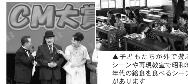
▲子どもたちが外で遊ぶシーンや再現教室で昭和30年代の給食を食べるシーンがあります