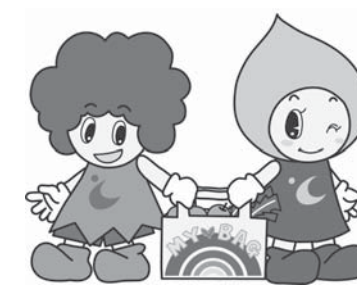
マイバッグの本体やマイバッグ運動のPRに…