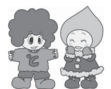
ウォームビズ商品やウォームビズ運動の商業などに…

※ほかにもさまざまなデザインがあります。詳しくは、市ホームページ内「環境」のページをご覧ください。