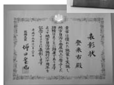
▲市に贈られた賞状と盾