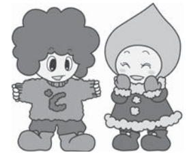
トメル君 オトメちゃん