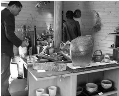
昨年の「峠の里・秋の市」の様子