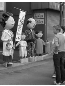
▲昨年の豊年かかし祭りの様子